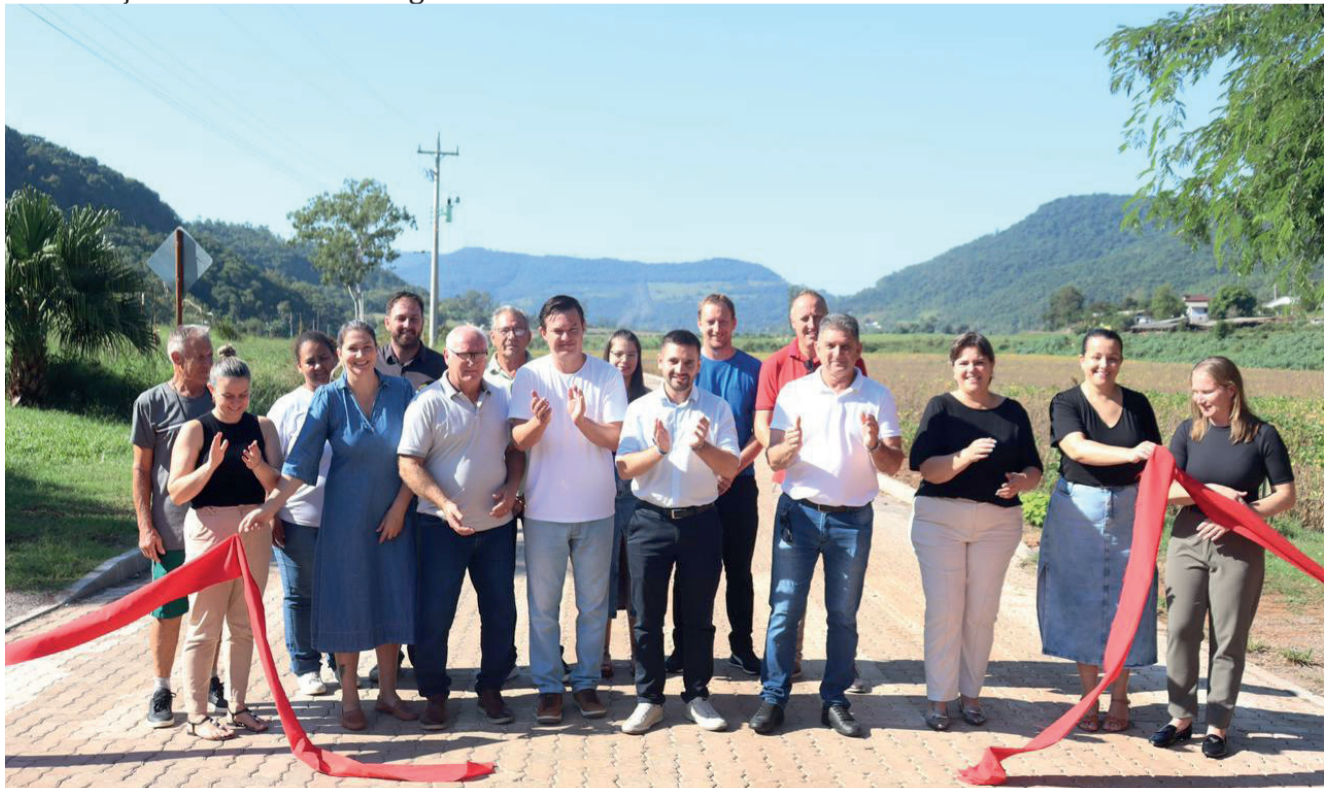
Inauguração da terceira etapa da pavimentação na Linha Santa Lucia integrou programação do Viva Muçum