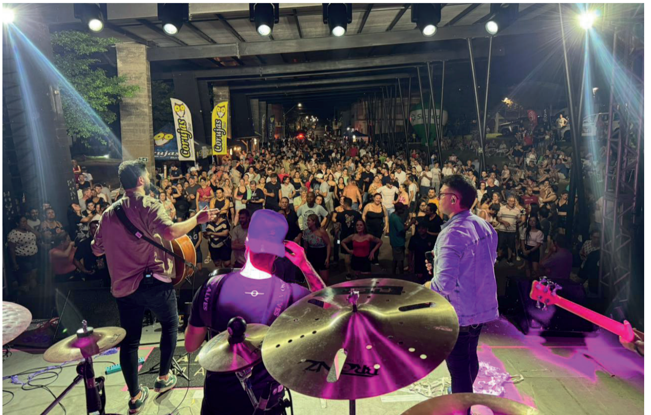
Os shows reuniram milhares de pessoas na rua coberta durante os dois dias de evento

A obra foi viabilizada por meio do Programa Pavimenta, da Secretaria Estadual de Desenvolvimento Urbano e Metropolitano (SEDUR),