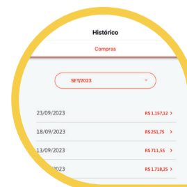
Seu Histórico de Compras