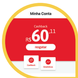
Sua Economia Usando Clube Desco (MENU CONTA > ESTATÍSTICAS)