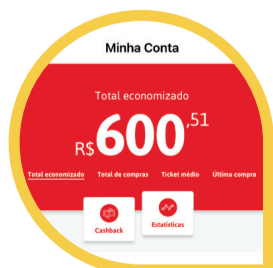
Cashback (MENU CONTA > CASHBACK)