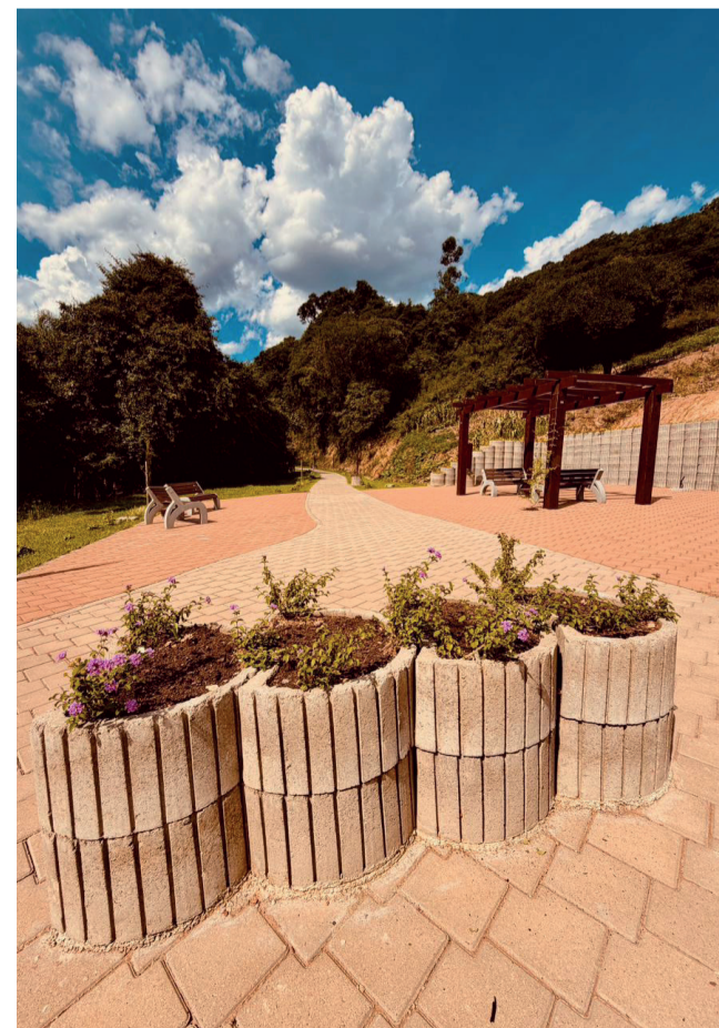
Espaços de integração e confraternização