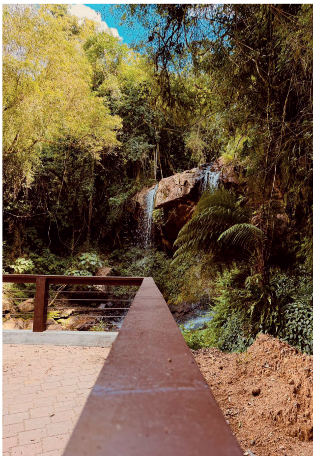
A cascata da Gruta e uma das belezas naturais