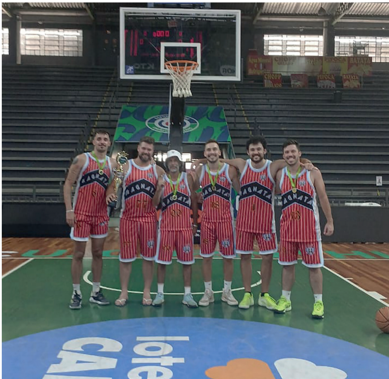
Mais um título: Magnatas da Bola conquista o 6º Racha Dunk de basquete 3x3 em Santa Cruz do Sul

O Magnatas da Bola foi Campeão da 6ª Racha Dunk de basquete 3x3. A equipe encantadense conquistou o título no último final de semana em Santa Cruz do Sul, com quatro vitórias em quatro jogos, a final foi contra o Saints Family e teve o placar de 20 x 16 para o Magnatas.