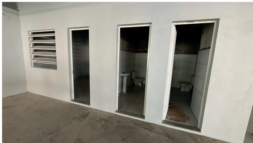
Construção de dois banheiros novos