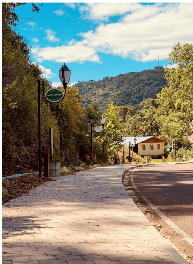
O caminho é rodeado de belezas naturais, espiritualidade, que se unem a história da comunidade

O caminho, assim como a Gruta Nossa Senhora de Lourdes, contará com iluminação especial e personalizada, garantindo ao visitante uma experiência ainda mais especial.