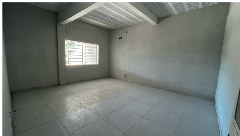
Construção de mais duas salas de aula