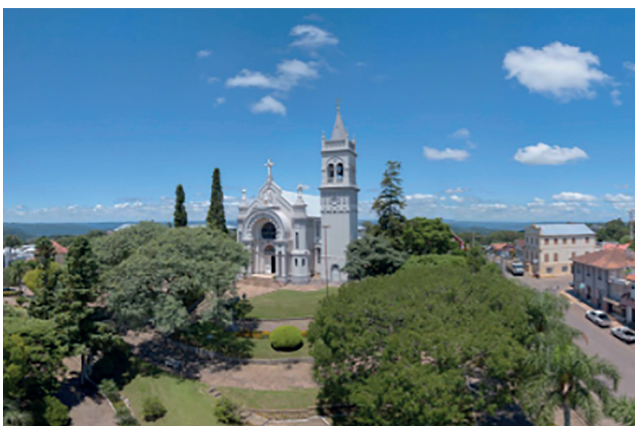
Igreja Matriz Nossa Senhora da Saúde