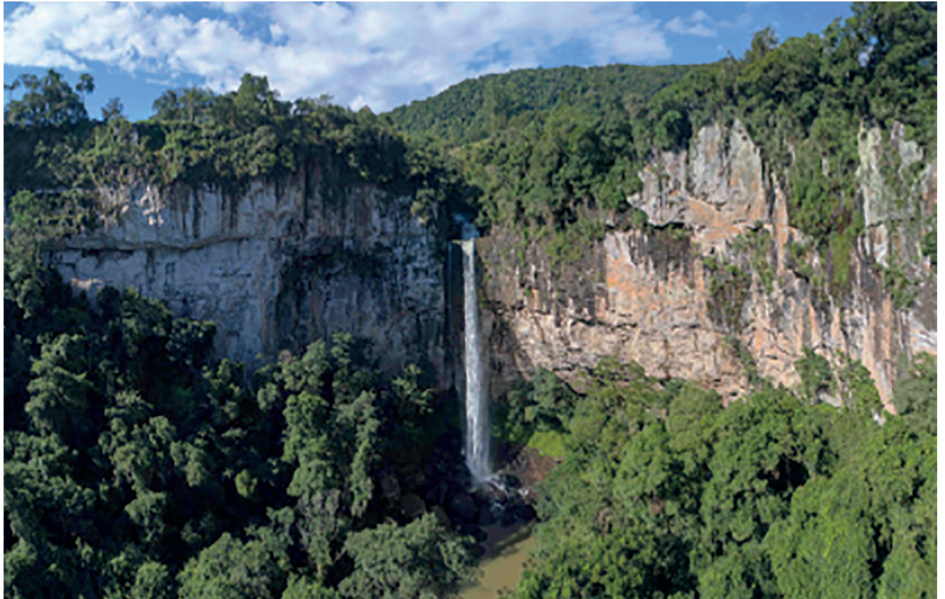
Cascata dos Marin é um dos locais mais visitados de Cotiporã

A cidade também tem belezas naturais que encham os olhos a Cascata dos Calza, é um