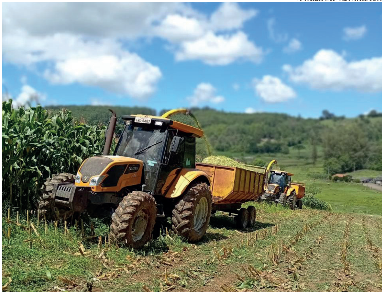
Produtores de Coqueiro Baixo devem colher uma das melhores safras de silagem da história

A silagem é fundamental para garantir a alimentação do rebanho ao longo do ano, assegurando melhor desempenho na produção de leite e no gado de corte, além de fortalecer a economia rural de Coqueiro Baixo.