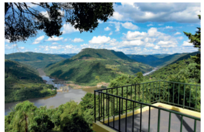
Belvedere do Vale da Ferradura