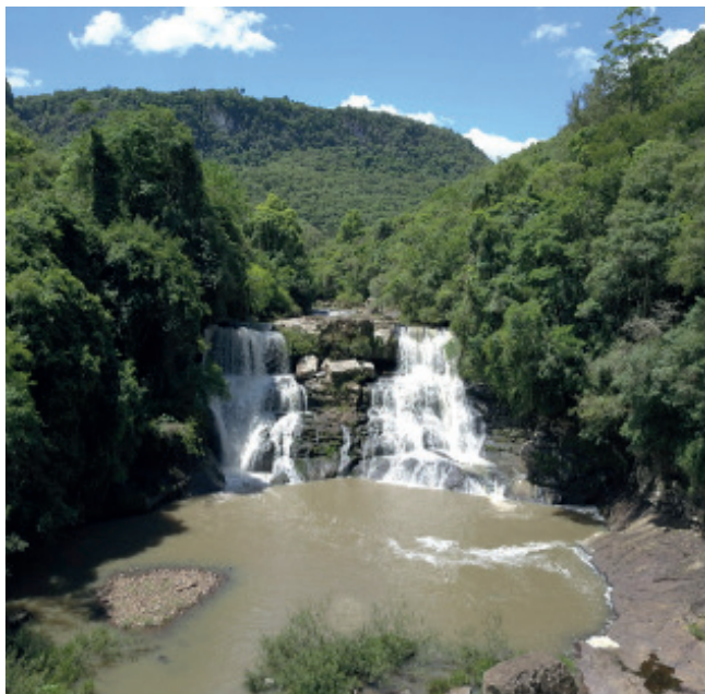
Cascata dos Calza