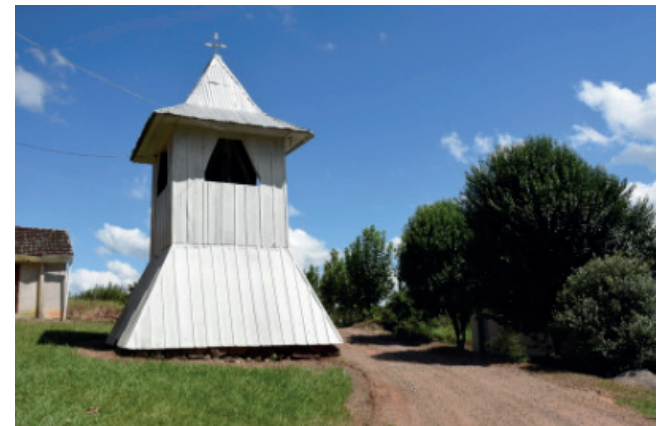
Campanário São Vicente