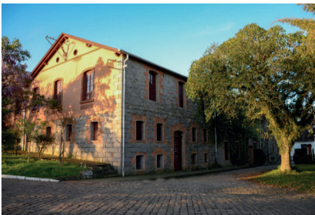
Casas típicas da imigração italiana

Outro local de beleza natural incrível é a a Cascata dos Marin localizada no Arroio Sapatinho, a seis quilômetros da sede, a cascata possui duas quedas: uma de 80 metros e outra de 60 metros, tornando-a uma das maiores da região. Além de fazer a trilha de acesso à uma das piscinas naturais formada pela primeira queda, os visitantes podem se admirar com a vista do vale, mirantes, e tomar banho de rio.