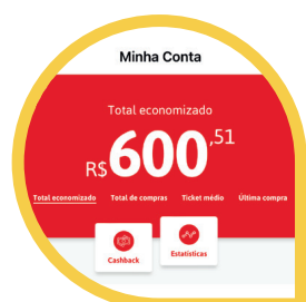
Cashback (MENU CONTA > CASHBACK)