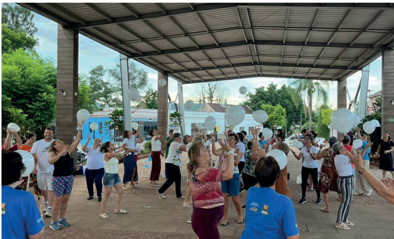
Integração reuniu grupos do CRAS e a população de Roca Sales

A equipe do CRAS destacou que o evento foi organizado com muito cuidado e dedicação, resultado de um trabalho prévio de mobiliza-