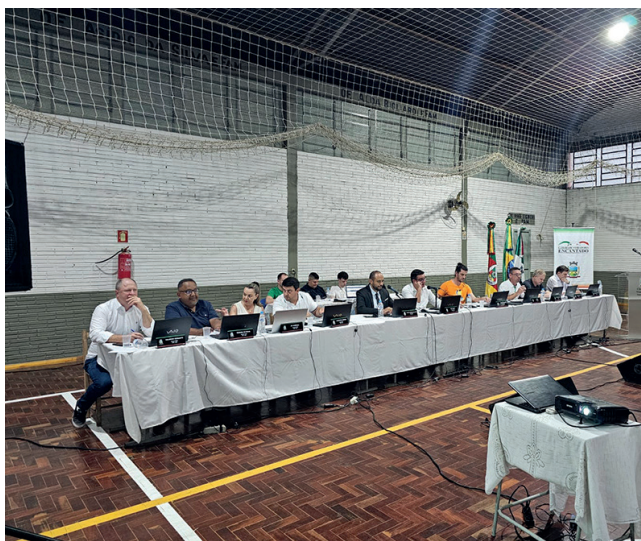
Vereadores ouviram as demandas