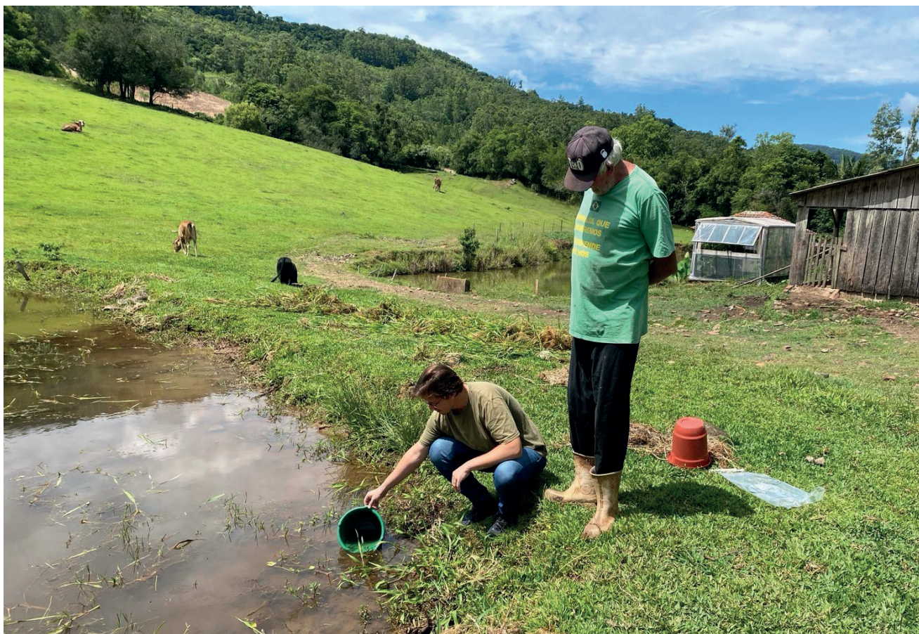
Mais de 2,6 mil alevinos de diversas espécies, como tilápia, carpas (cabeça grande, húngara, colorida, capim e prateada), lambari, dourado e jundiá foram distribuídas nesta quarta etapa