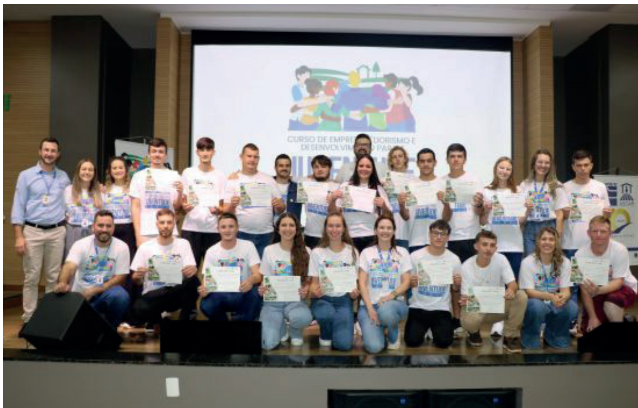
17 jovens de diversos municípios participaram da qualificação

Durante os seis módulos mensais iniciados em junho, e que totalizaram 120 horas-aula, foram diversas palestras, oficinas, visitas, atividades de campo e outras metodologias que buscaram olhar a juventude em toda a sua complexidade. Na última etapa, os estudantes foram instigados a apresentar um projeto produtivo como forma de consolidar os conhecimentos acumulados. "A intenção é estimular as aptidões dos jovens, focando em