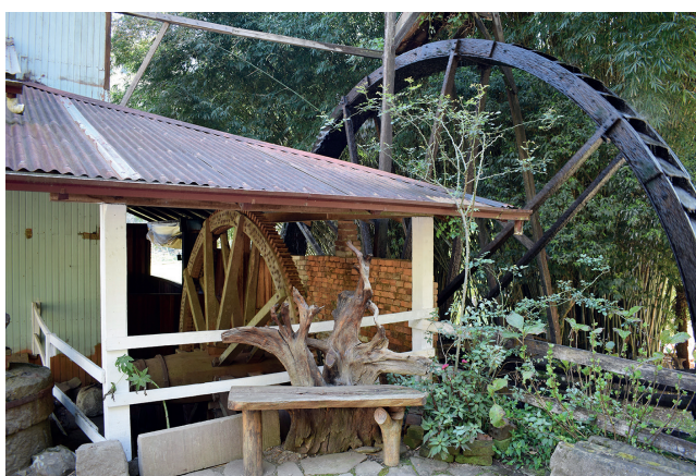
Visitantes podem conferir a roda d'água que toca o moinho e todas as máquinas que fazem a farinha