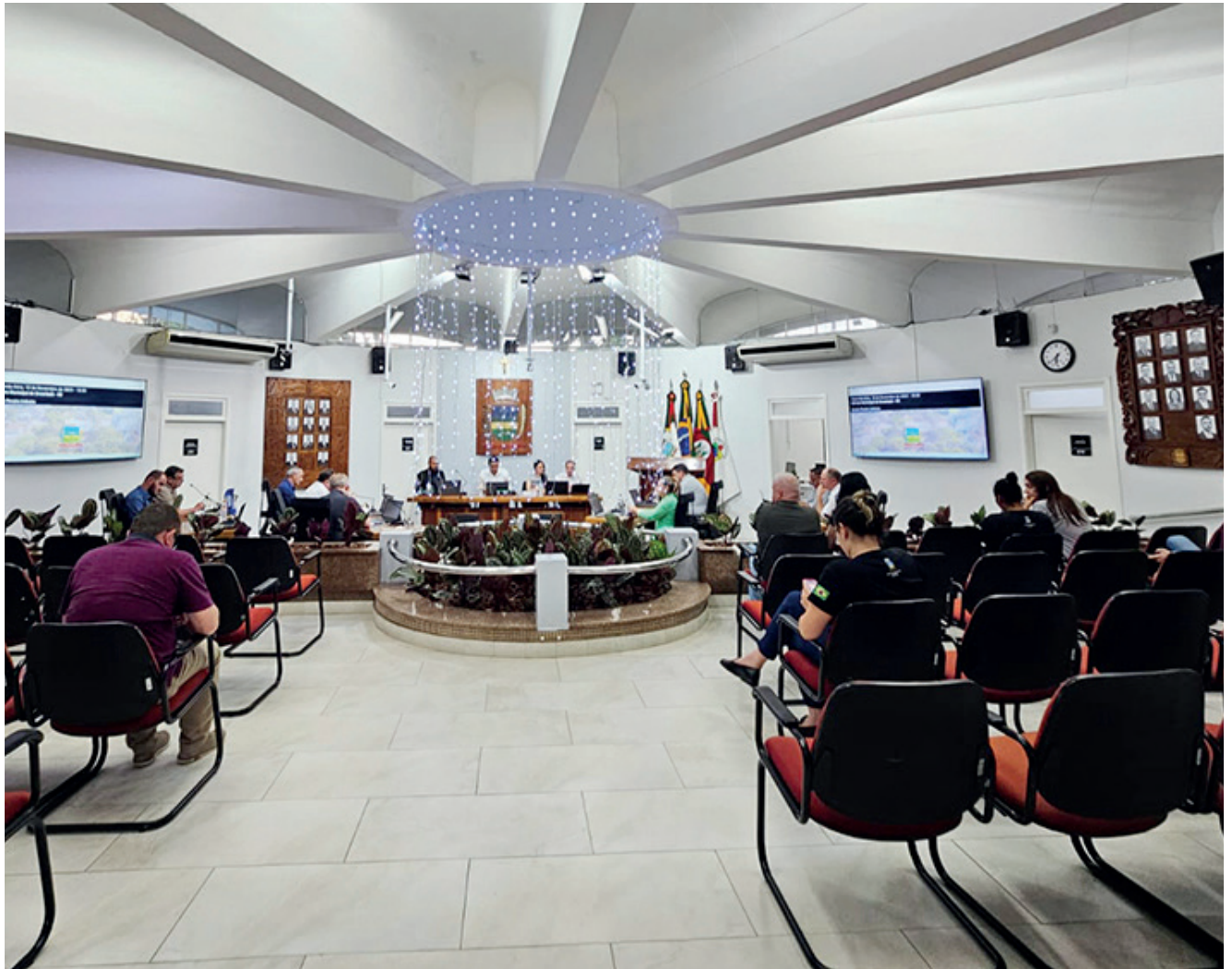
Semana da Câmara será realizada na sede do Legislativo de Encantado