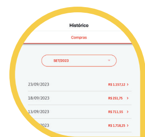
Seu Histórico de Compras