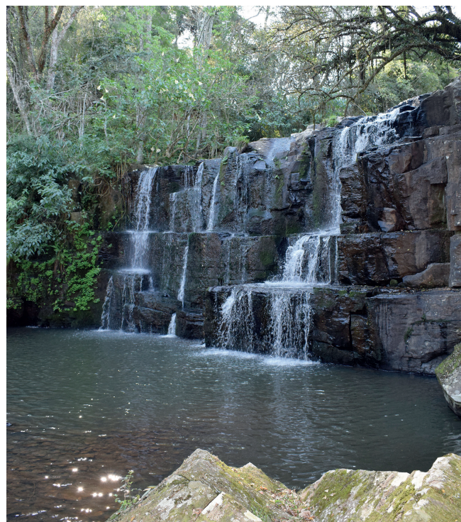
Cascata rende lindas fotos

Agendamento pelo WhatsApp (51) 99549.4004 ou Instagram @moinhocolonial-pezzi. O Moinho está localizado na ERS 129 km 95 em Vespasiano Corrêa bem ao lado do pórtico principal de acesso à cidade, a 80 metros do asfalto.