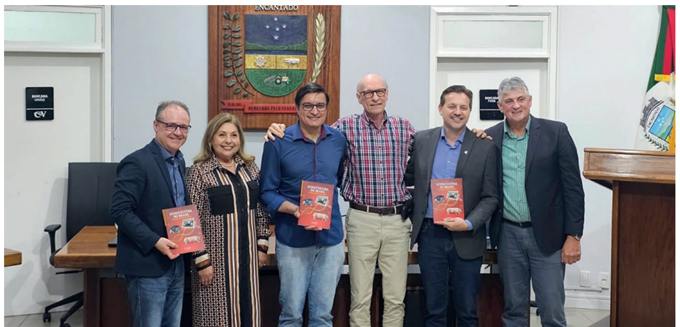
Lançamento oficial ocorreu na Câmara de Vereadores de Encantado na segunda-feira