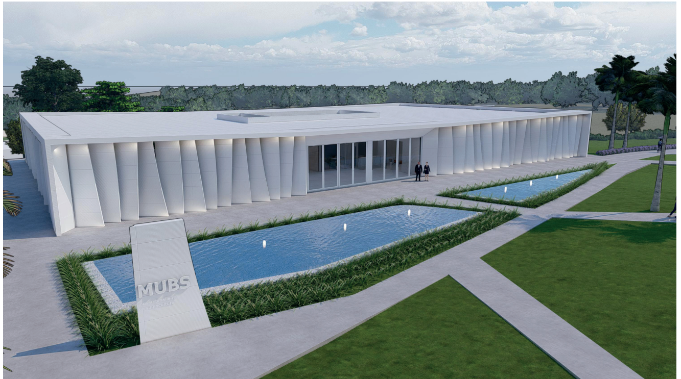
Imagens do Projeto Arquitetônico do Museu Brasileiro do Suíno