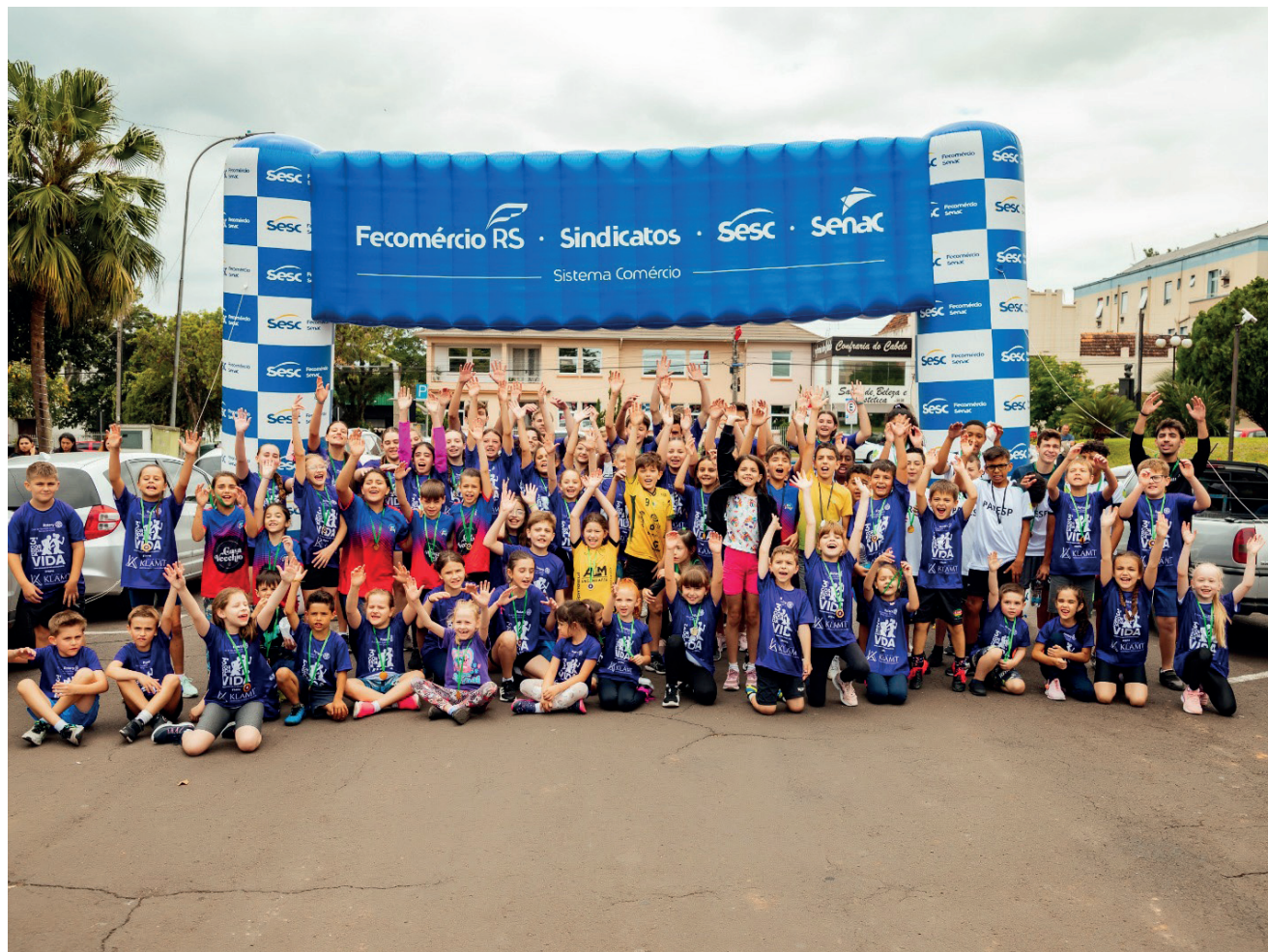
Evento incentiva hábitos saudáveis em crianças e adolescentes de até 17 anos

A 4ª edição da Corrida da Vida Novas Gerações, de Venâncio Aires, está com inscrições abertas e promete movimentar a Travessa São Sebastião Mártir em 26 de outubro, a partir das 8h. Promovido pelo Rotary Novas Gerações, o evento busca incentivar a prática esportiva, a integração e a adoção de hábitos saudáveis entre crianças e adolescentes de até 17 anos.