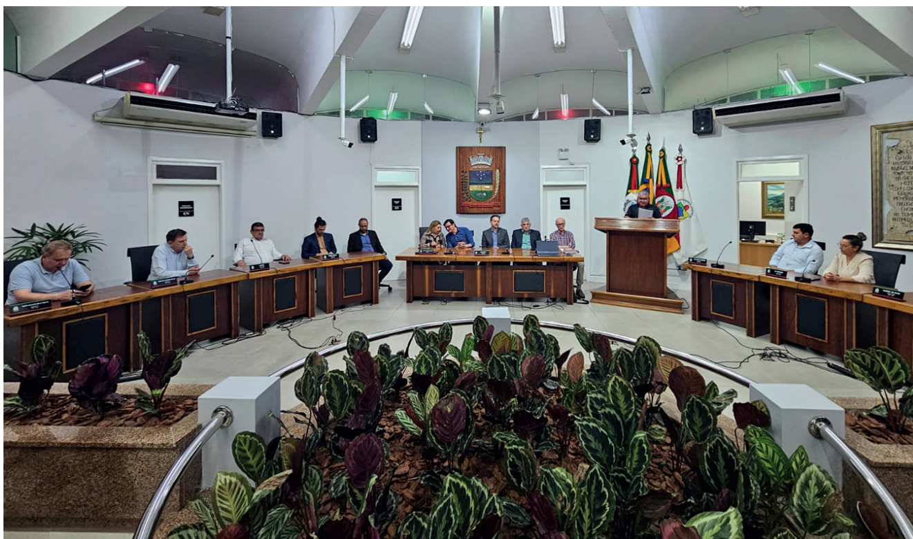
Após a sessão ordinária aconteceu o lançamento oficial do MUBS

Na noite não ocorreu a tribuna do vereador, mas na comunicação de bancadas os vereadores elogiaram a ACIE pela prestação de contas da Suinofest, onde mais de 40 mil visitantes visitaram Encantado, sendo que no salão gastronômico 60% do público foi de turistas de fora da região e 40% de pessoas da região. Além disso, cerca de R$ 16 milhões giraram durante o evento ocorrido em junho em Encantado.