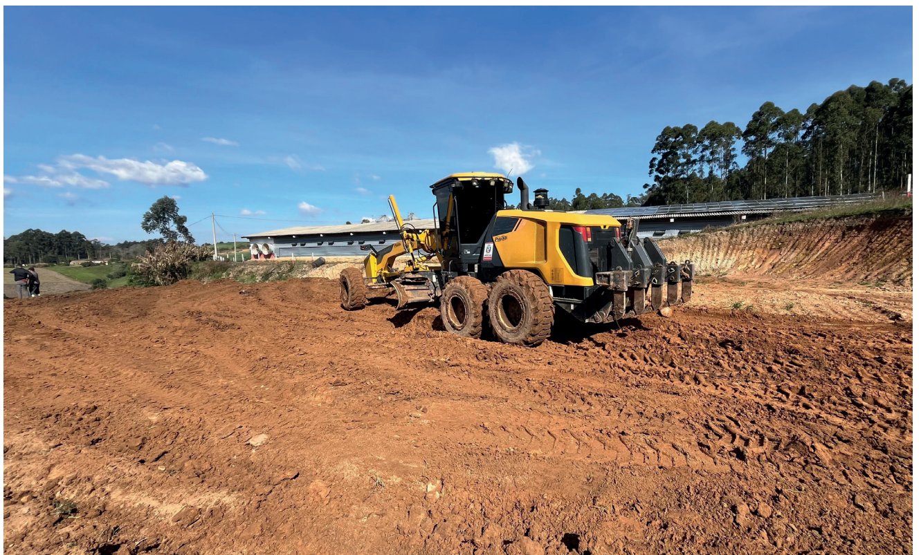
Coqueiro Baixo incentiva construção de residências com serviço de terraplanagem

"A preparação do terreno é parte importante da obra e muitas vezes onera demais para que a pessoa possa fazer dentro do prazo que gostaria. E em muitos casos, algumas casas deixam de ser construídas se tiver que arcar com o custo das máquinas terceirizadas, por isso, a Administração está auxiliando o serviço de terraplanagem, dando maior agilidade a novas obras de residências e trazendo mais um benefício importante a nossa população."