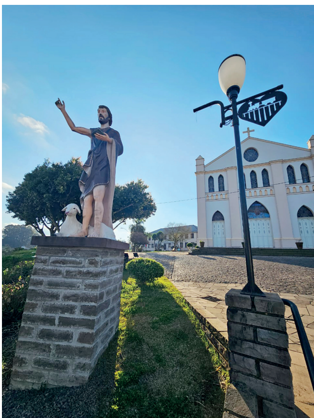
Em frente à Igreja, São João Batista abençoa a cidade

rior foi mantido com as belíssimas pinturas em todo o teto e nas paredes que são uma releitura da narrativa visual da obra perdida de Angelo Fontanive de 1927. A Igreja Matriz de São João Batista de estilo neoclássico, é uma construção imponente e histórica.