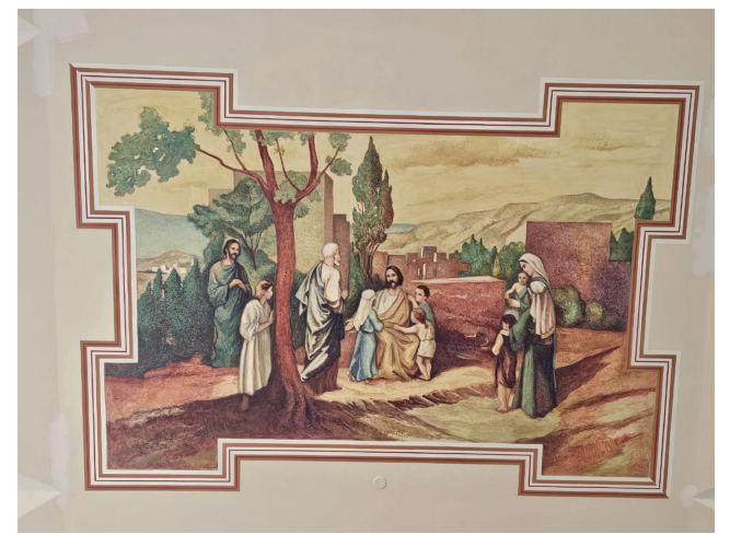
com pinturas impressionantes por todo o teto