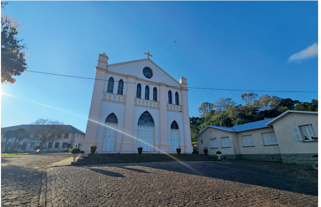
No alto da escadaria que inicia na Rua Principal de Vespasiano Corrêa está a Igreja Matriz São João Batista

perança para ser Distrito Vespasiano Corrêa. E anos depois passou a ser município. A Igreja que está localizada no mesmo lugar no alto de uma escadaria, é a mesma até hoje, mas passou por reformas em 1974, em 2000 e em 2020. Mesmo com as reformas seu inte-