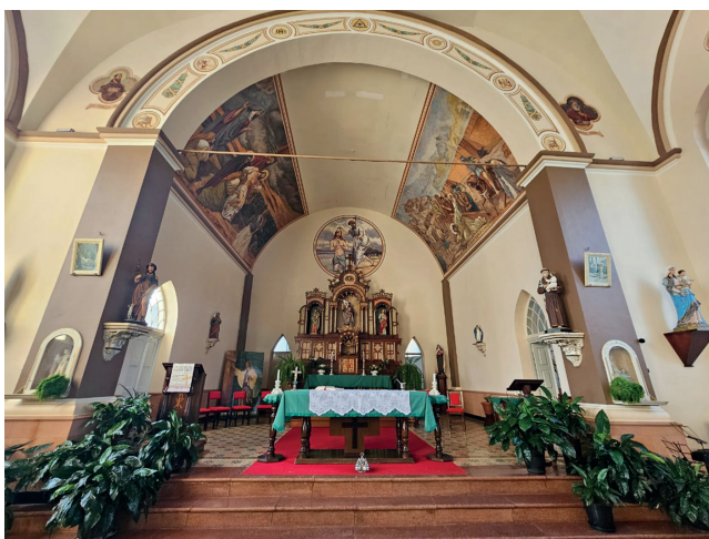
No altar também há duas pinturas no teto belíssimas