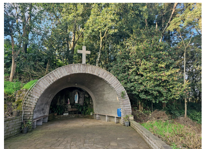
e na parte externa, além da escadaria tem a gruta