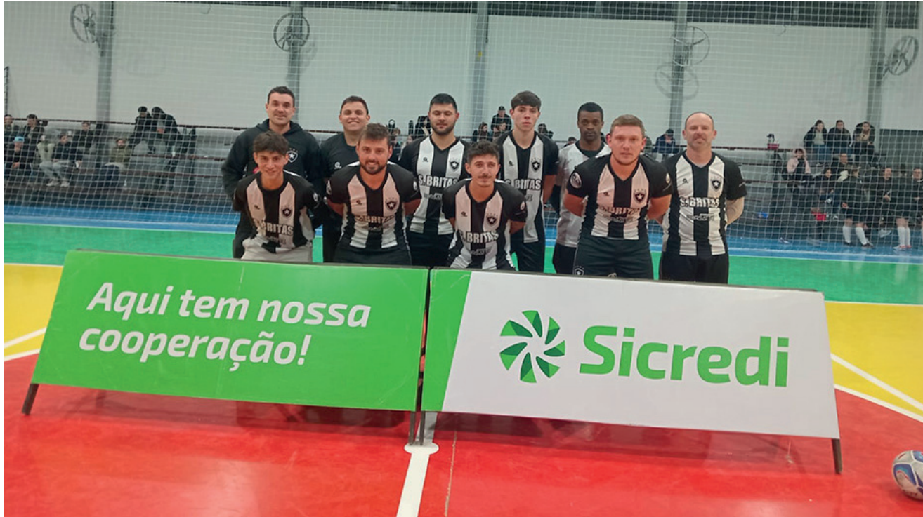
Municipal de Futsal de Nova Bréscia

Na terça-feira (10) aconteceu a 4ª rodada do Municipal de Futsal de Nova Bréscia Copa Sicredi. Na primeira partida pela categoria Sub15, Doutor Ricardo e Coqueiro Baixo empataram em 3 a 3, após pelo masculino, a equipe do Borrachos venceu o Virado em Pensamentos por 2 a 0. O terceiro jogo da noite foi pela categoria feminino e teve a vitória do Fênix por 1 a 0 frente a Relvado, e no último jogo da rodada, a equipe do Vep venceu o Botafogo por 2 a 1 pelo masculino.