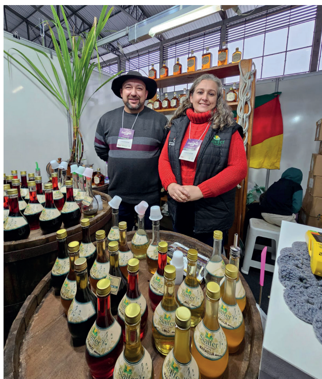
Licores e outras delícias tem na Suinofest