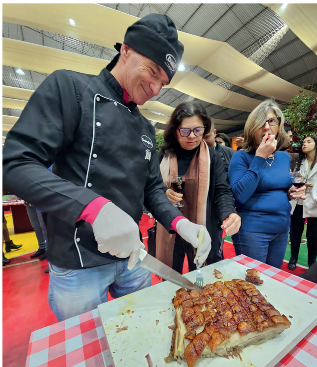
Suinofest é o maior evento de carne suína do Estado

do. Hoje (13) das 8h às 13h reunião de secretários e conselheiros municipais de educação sobre o tema: Planos Decenais de Educação AMAT/AMVAT - 2025 a 2035, no auditório do Sicredi. Às 17h, roda de conversa Promove Lajeado com participação dos programas Estímulo RS, Regenera e Promove, na ACI-E. Às 18h30min, palestra: "Possibilidades da Inteligência Artificial para Negócios", no espaço do GAN Anita Garibaldi. No sábado (14) às 19h premiação do Concurso Fotográfico no Palco Cultural da Suinofest. E no domingo (15), às 15h, último sorteio da Campanha Festival Encantado de Prêmios no estande do Sicredi.