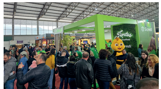
Estandes e Pavilhão da Agroindústria familiar também receberam grande público