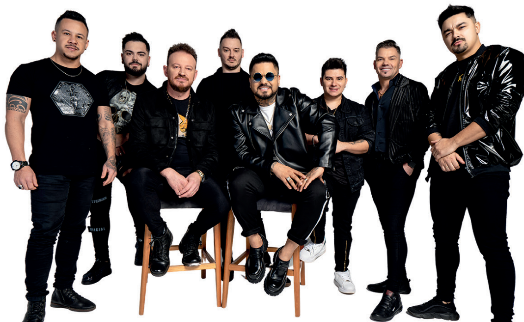
Banda Rainha Musical fará show de encerramento da ExpoMuçum

14h - Festival Kids com a presença de personagens diversos 16h - Badin 17h30min - Encerramento Oficial da 5º ExpoMuçum 18h - Show com Adson e Alana 19h30min - Show com Rainha Musical