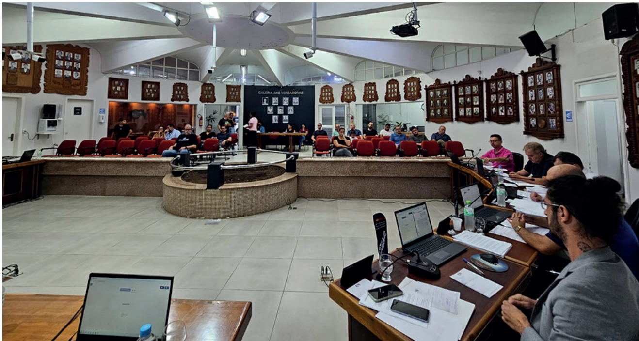
Vereadores expõe demandas urgentes que estão afetando a população

Valdecir Gonzatti falou novamente da tragédia anunciada dos deslizamentos. "No dia 28 de maio de 2024 vieram geólogos na União e fizeram um estudo, um levantamento com fotos aéreas. Recentemente teve