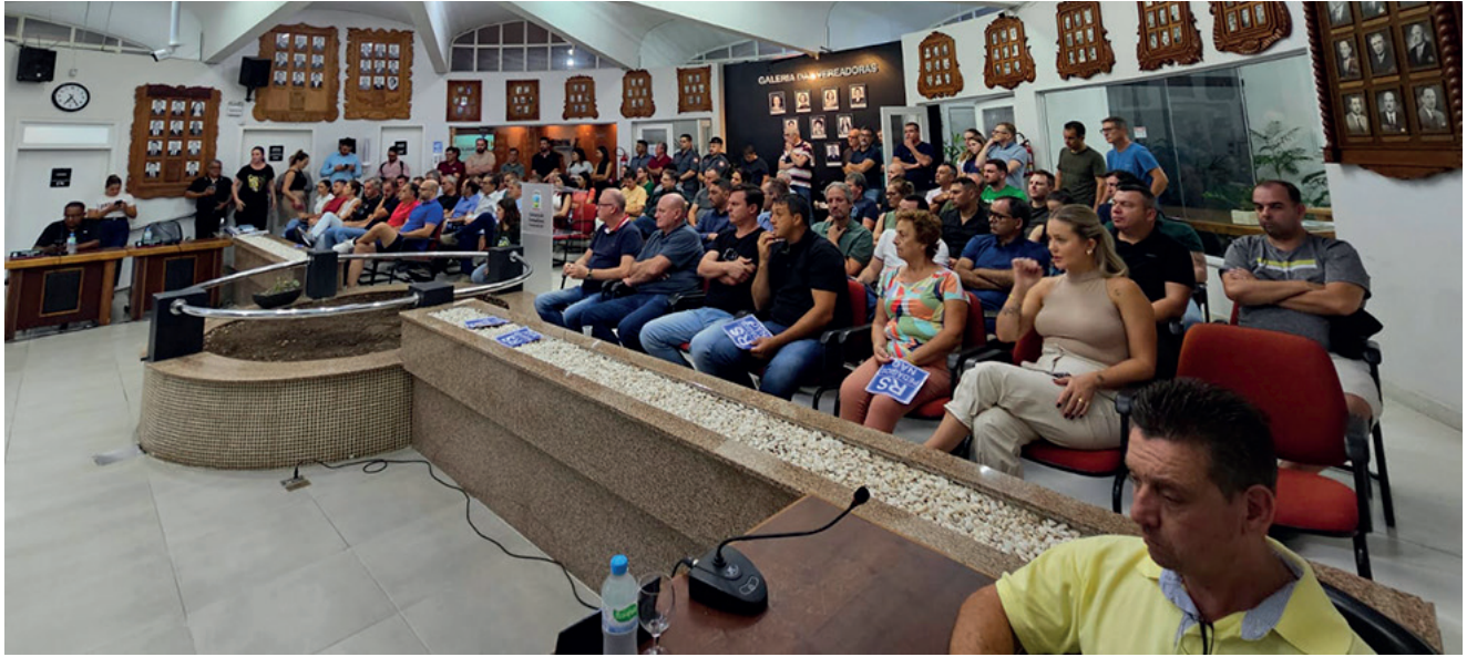
Comunidade encantadense e da região lotou a câmara de vereadores para discutir o pedágio