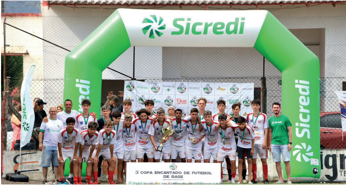
CFM categoria Sub 15 - Vice-Campeão na Série Ouro

A 3ª Edição da Copa Encantado de Futebol reuniu mais de 800 atletas entre os dias 17 e 21 de dezembro com jogos no Estádio das Cabriúvas e do Lajeado. Além dos atletas, muitos pais e familiares dos jogadores vieram para Encantado para acompanhar a competição, o que impulsionou a economia do município, movimentando hotéis, restaurantes e todo comércio local.