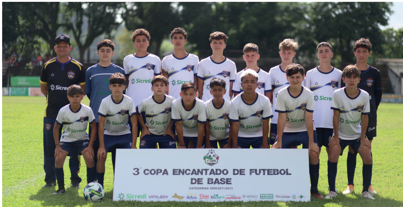
CFM categoria Sub 13 - Vice-Campeão na Série Ouro

Na Série Prata categoria Sub 15 a final acabou empatada em 0 a 0 entre Ser Caxias e Club Braow da Argentina. Na decisão nos pênaltis o Caxias se sagrou campeão vencendo por 5 a 4 nas cobranças. Pela categoria Sub 13 o Al Criciúma conquistou o campeonato ao golear o Nacional por 4 a 0 na final. O Al Criciúma também ficou com o título na categoria Sub 11 ao vencer o Caxias por 2 a 1 na final da Série Prata.