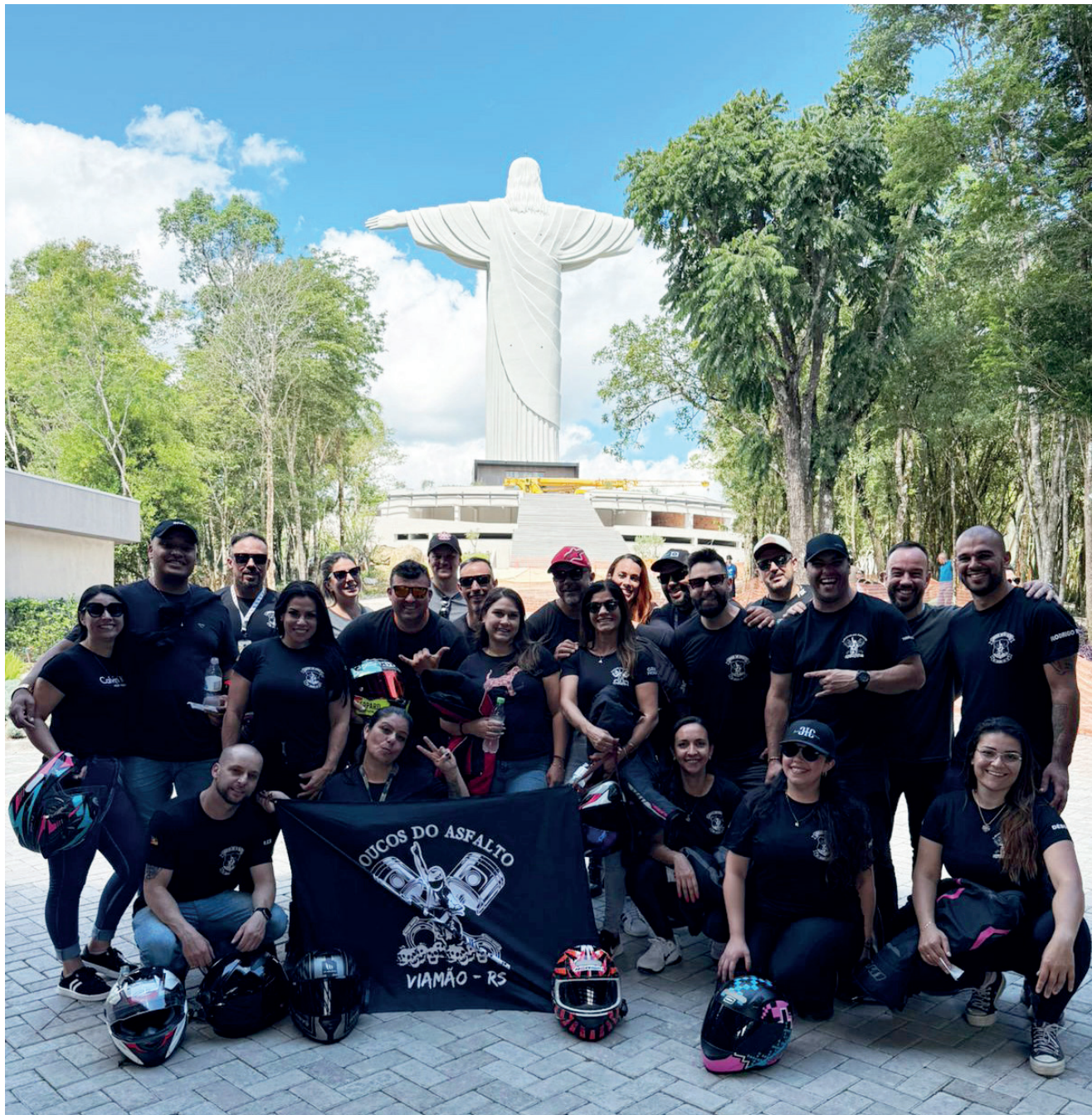
Pessoas de diversas cidades, estados e países já vieram conhecer o Cristo Protetor que soma 310 mil visitas

O público pode visitar o complexo todos os dias de janeiro, das 9h às 17h. A entrada é R$ 30 para adultos, R$ 15 para idosos e encantadenses e crianças até 12 anos não pagam.