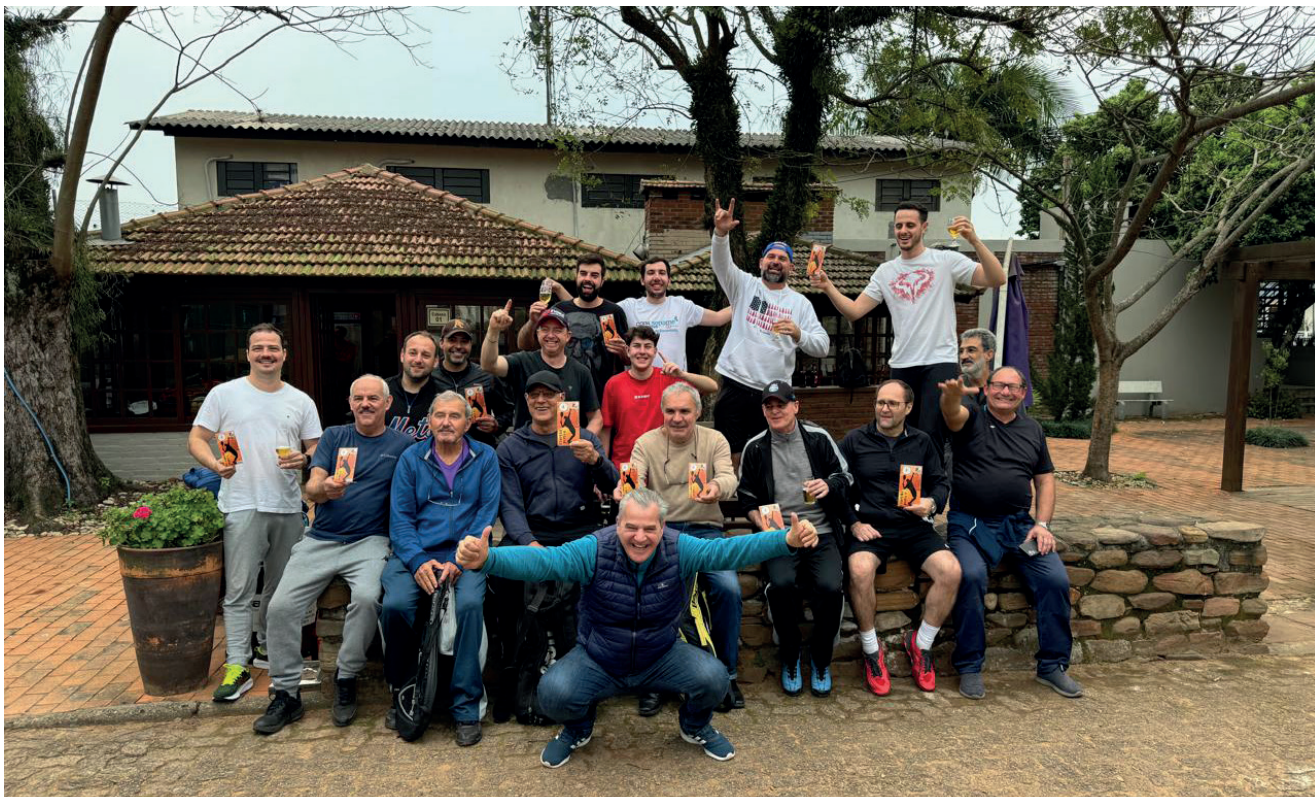
Tenistas do CC também comemoraram a vitória de Encantado no 39º Torneio Integração

O evento esportivo é realizado em quatro rodadas, uma em cada cidade. A final aconteceu em 31 de agosto em Santa Cruz do Sul. O torneio é dividido em oito categorias de duplas e Encantado participou com 16 jogadores. O 40º torneio que está em andamento terá a final em Encantado no mês de maio de 2025.