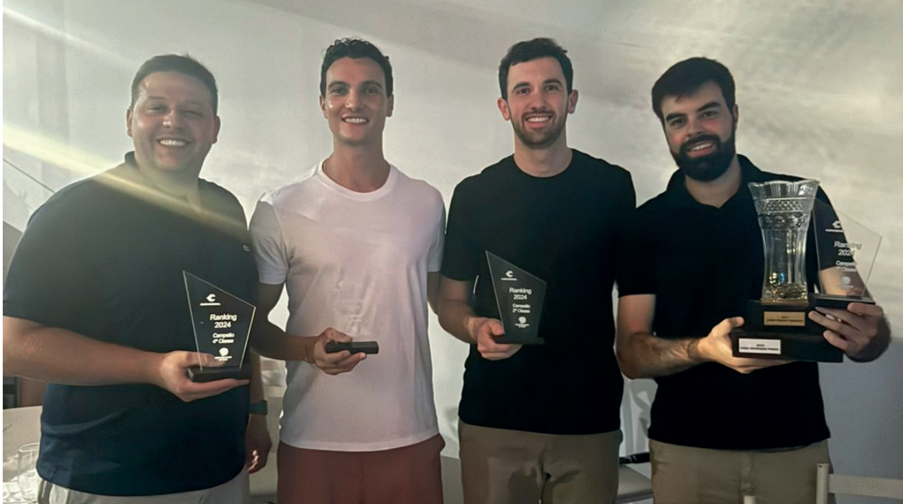
Campeões da 9ª edição do Ranking de Tênis do Clube Comercial

O Clube Comercial (CC) de Encantado entregou no sábado (21) as premiações da 9ª edição do Ranking de Tênis do CC para quatro categorias.