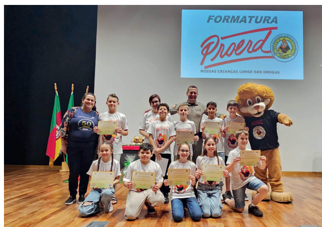
Escola Municipal Batista Castoldi