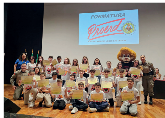
Escola Estadual Monsenhor Scalabrini