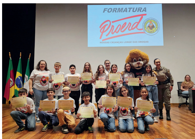
Escola Estadual Antônio de Conto