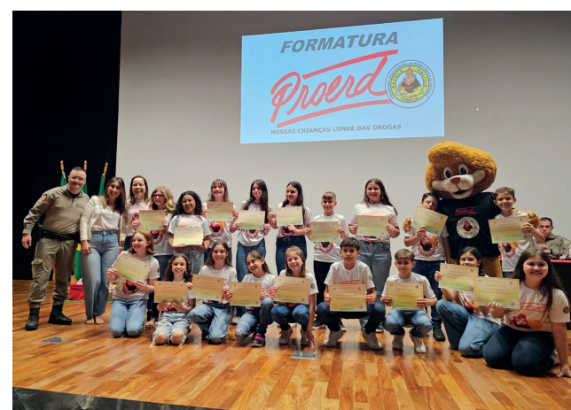
Escola Mundo Encantado Turma B