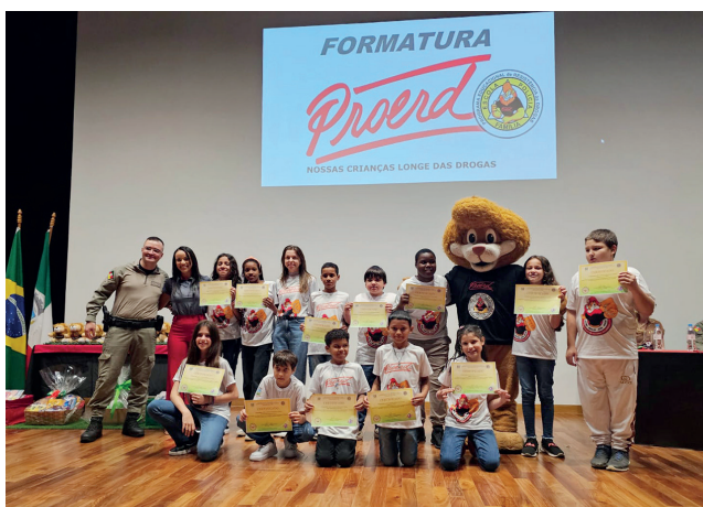
Escola Municipal Érico Veríssimo