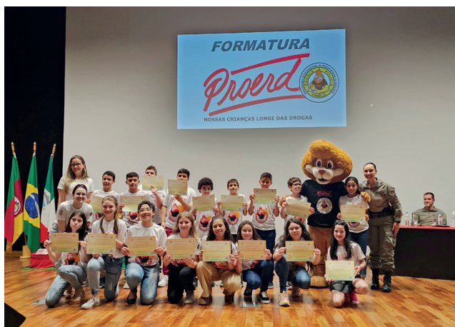
Centro Municipal de Educação Turma A