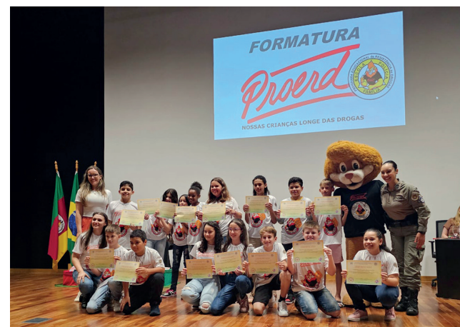
Centro Municipal de Educação Turma B