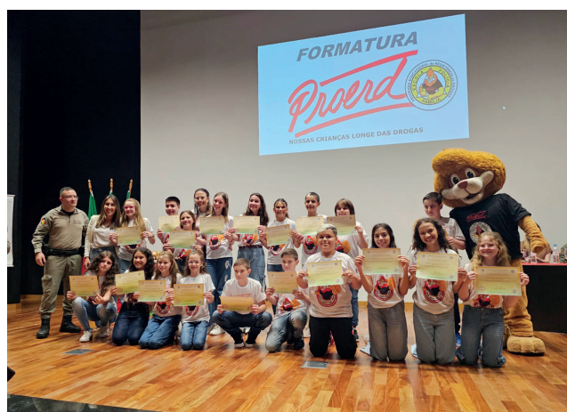
Escola Mundo Encantado Turma A