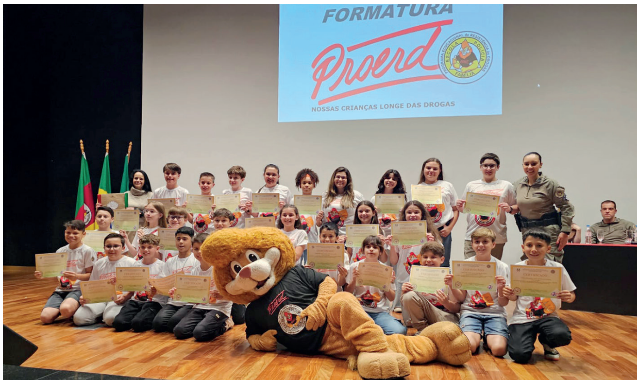
Escola Estadual Farrapos

198 alunos receberam o certificado de conclusão do Proerd. Oito escolas e dez turmas do 5º ano foram atendidas pelo programa. Além da entrega dos certificados, a noite também contou com a premiação das melhores redações e dos alunos destaque por escola. E a melhor redação no geral. Conforme a BM, o Proerd, proporciona um contato próximo com os alunos, fortalecendo a parceria entre a comunidade escolar e a Brigada Militar, e também contribuindo significativamente para a formação de cidadãos mais conscientes e preparados para fazer escolhas saudáveis em suas vidas.