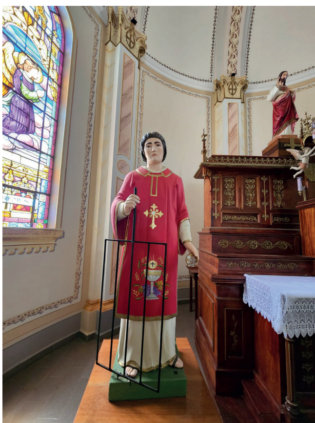
Estátua em honra a São Lourenço Mártir