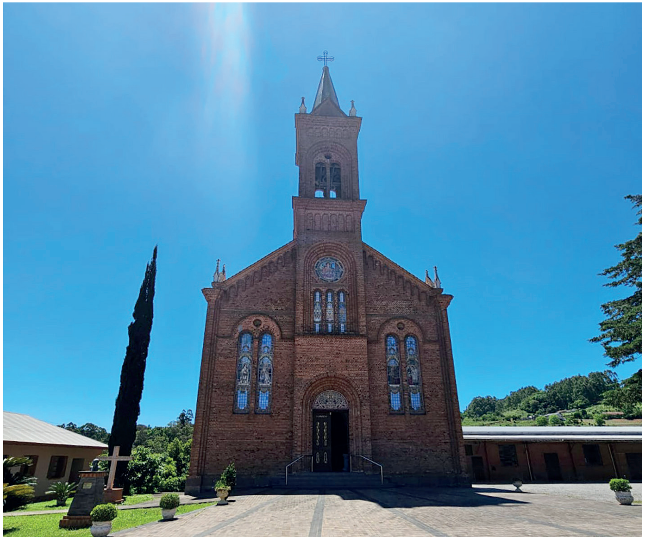
A Igreja Matriz São Lourenço Mártir está localizada no coração de Coronel Pilar

Impossível passar pelo município de Coronel Pilar e não se encantar com o lugar, não fazer uma parada e conhecer a Igreja por dentro e também todo o entorno desse belíssimo templo que emana paz e religiosidade. 10 de agosto é o dia do Padroeiro, nesse mês sempre é realizado uma grande festa em homenagem a São Lourenço Mártir, santo espanhol. Em 2024 a Paróquia comemorou seu centenário, e neste final de semana, a Igreja e o Salão Paroquial serão palco da Expo Coronel Pilar.