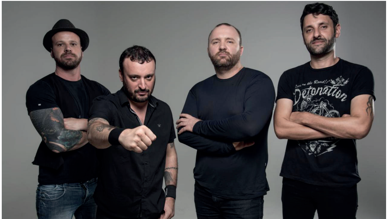
Sunset Riders sobe ao palco no sábado às 19h30min

10h30min - Alunas do Projeto Arte e Dança 11h às 13h30min - Alunos de música e artistas locais • Grupo de Cantoria Vocce dei Monti 14h – Reverendo Jones