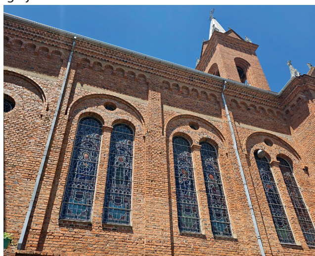
A arquitetura impressionante do templo de fé e as imagens sacras no interior da igreja chamam atenção