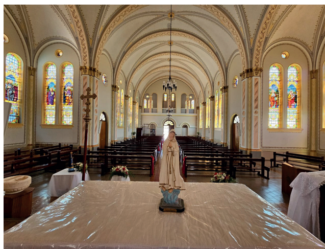
Igreja Matriz vista do altar