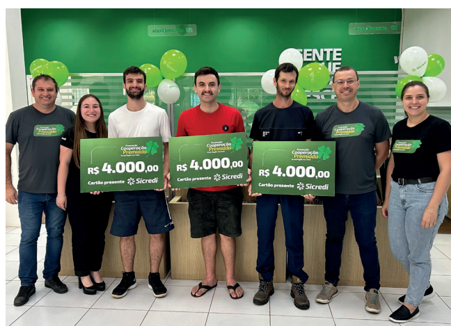
Ganhadores do 2º sorteio Agência Relvado

Faça seus negócios com o Sicredi Região dos Vales e participe!