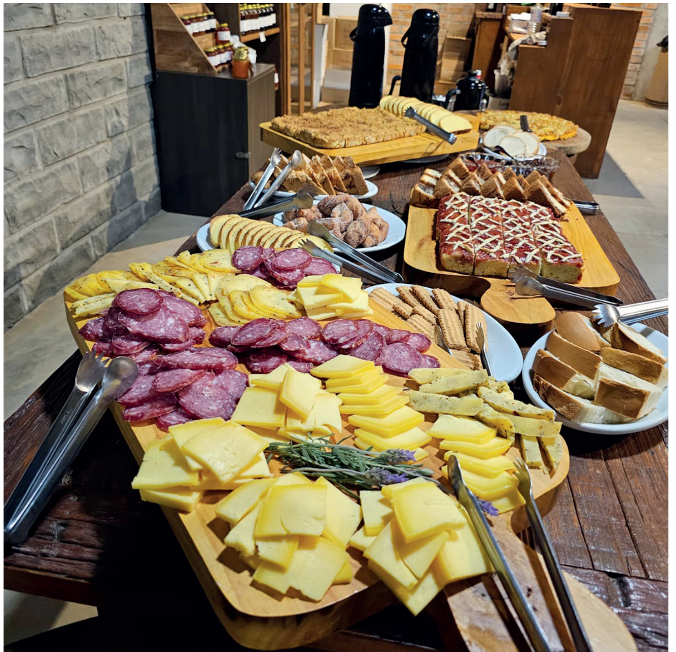
A deliciosa culinária italiana com sabor da casa da nona você encontra na Osteria Scalco em Guaporé

no você irá degustar costela de porco assada, nhoque com molho de salame, frango assado, massa, tortei, polenta brustolada, radicci cotti, sopa de capeleti, pien, salame, queijo, pão colonial e sobremesa. Já no café da colônia as delícias preparadas são torta italiana, pizza da nona, geleias, grostoli, pão de milho, esfregolão, queijo, salame, polenta brustolada, pão de forno, suco de uva,