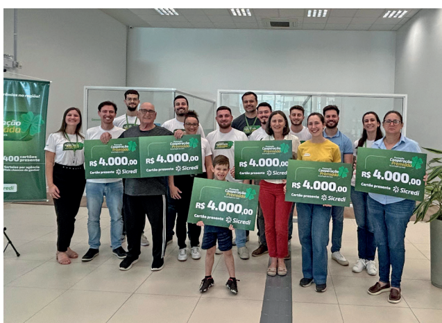
Ganhadores do 2º sorteio Agência Encantado Cidade Alta