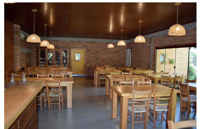
Espaço da culinária da Osteria Scalco