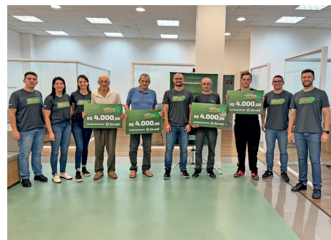
Ganhadores do 2º sorteio Agência Nova Brésia