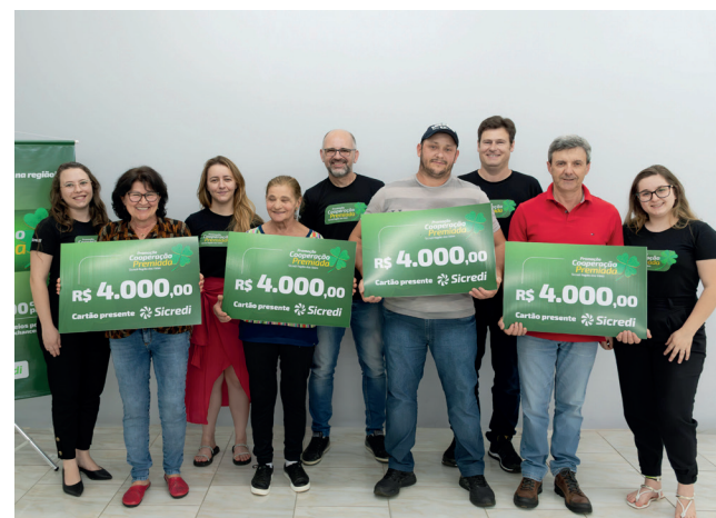
Ganhadores do 2º sorteio Agência Dois Lajeados