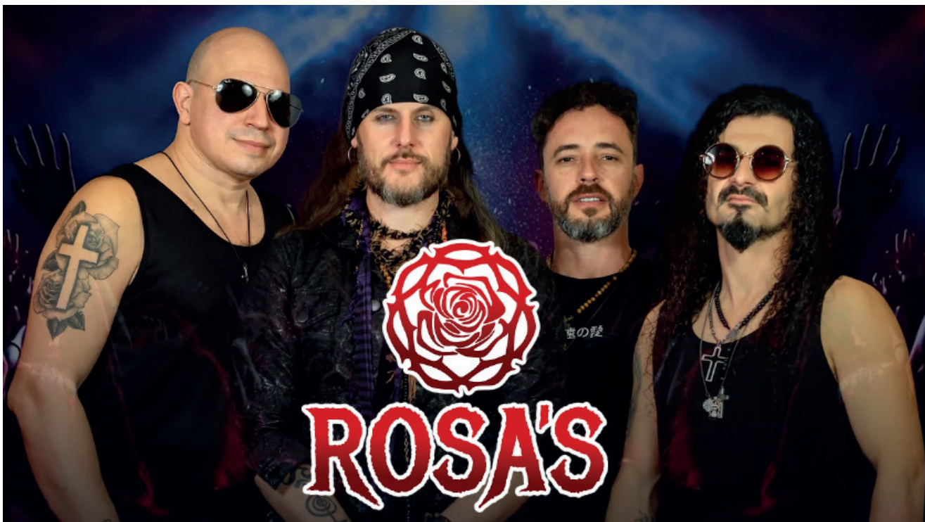
Banda Rosa's fará show no domingo, 1º de dezembro