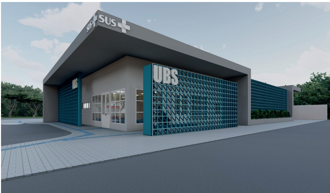
UBS serão construídas no bairro Jacarezinho e no Loteamento Jardim da Fonte

As estruturas contam com consultórios odontológicos, salas de vacinação, medicação, coleta de exames, e áreas de recepção e preparo de medicamentos. Os postos também dispõem de farmácias para dispensação de medicamentos e espaços destinados a atividades coletivas de promoção à saúde. O projeto das unidades foi planejado para