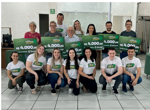
Ganhadores do 2º sorteio Agência Muçum