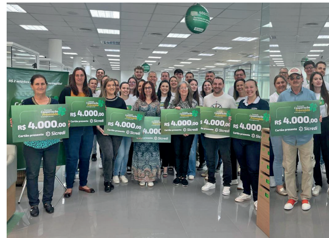
Ganhadores do 2º sorteio Agência Encantado Centro