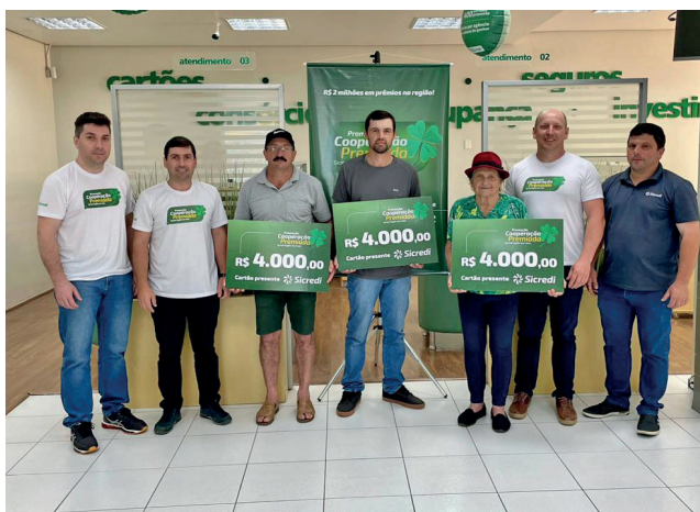
Ganhadores do 2º sorteio Agência Coqueiro Baixo