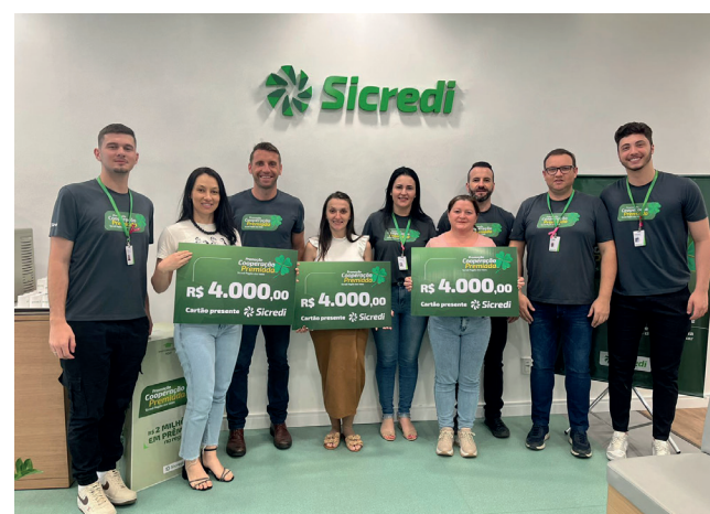
Ganhadores do 2º sorteio Agência Vespasiano Corrêa