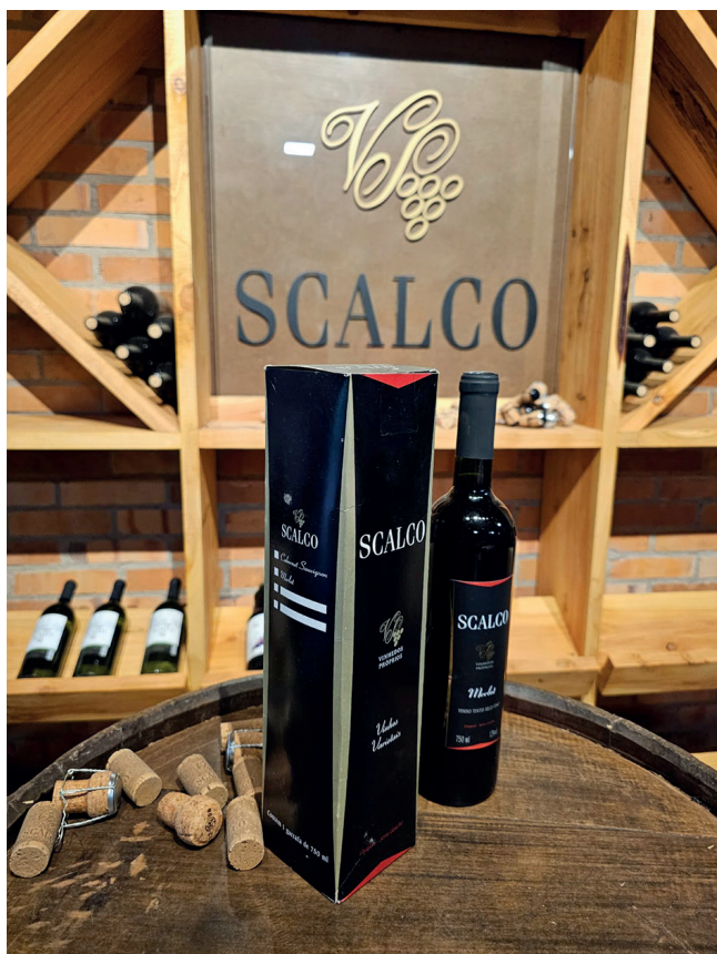
Venda de vinhos e sucos de produção própria

Todas as opções de visita precisam de agendamento pelo WhatsApp (54) 99937.5489 ou (54) 99958.0416. Nos domingos ao meio dia, normalmente o restaurante abre, mas para garantir é melhor ligar antes. Para saber mais siga no Instagram @vinicolascalco, @scalcoosteria e @luigipieroscalco.