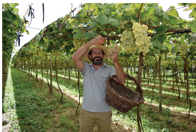
Vindima com a colheita da uva