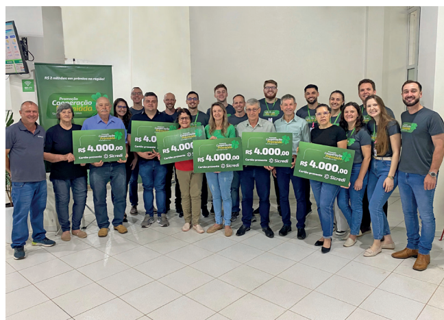
Ganhadores do 2º sorteio Agência Roca Sales