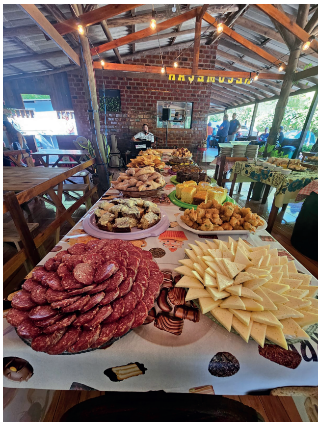
Neste domingo (29) também terá café colonial

acesso ao arroio e internet wi-fi. Tanto o camping, como a pousada e o restaurante atende todos os dias. Para mais informações e reservas seja para o café, o espaço de camping ou a pousada, pode entrar em contato pelo WhatsApp (51) 99380-6216, ou pelas redes sociais do estabelecimento, Facebook e Instagram: camping_paraíso_tropicalv13 e @pousada-ecabanastropical.