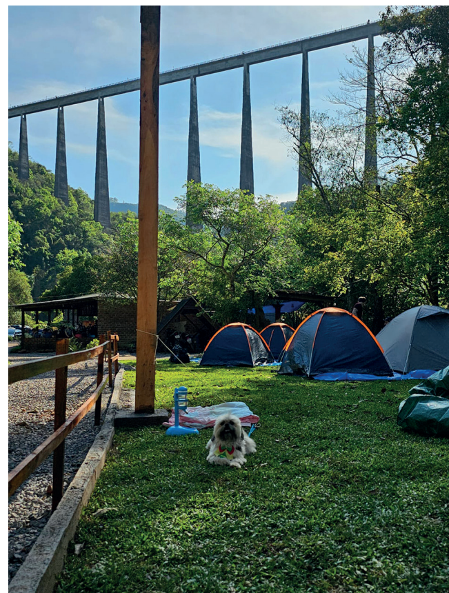
Espaço para camping tem uma vista linda do V13