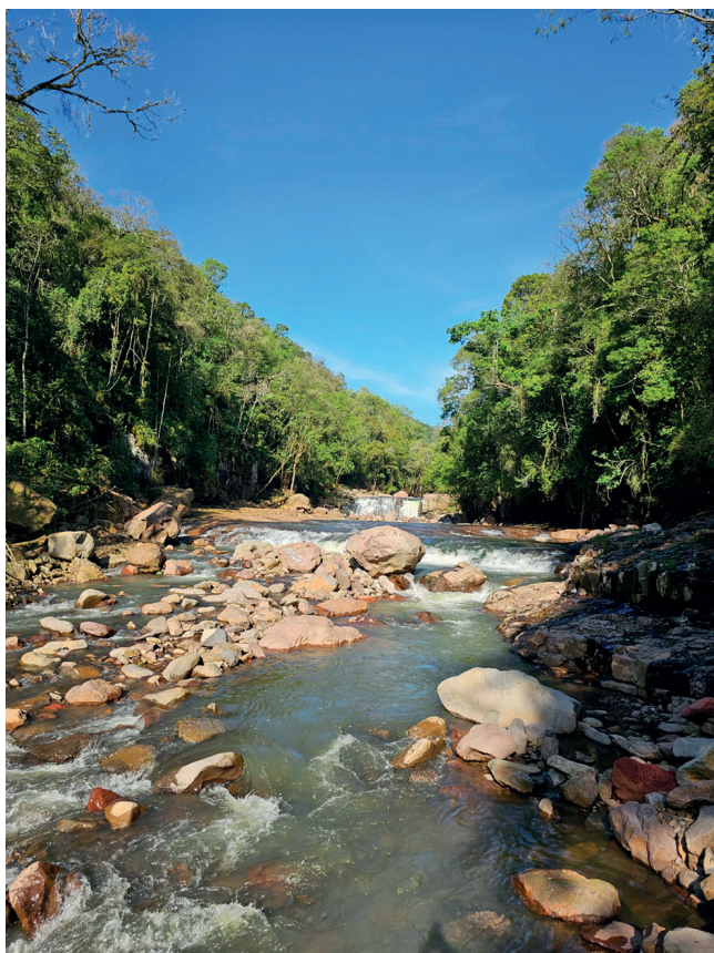
O riacho ao lado do camping é revigorante