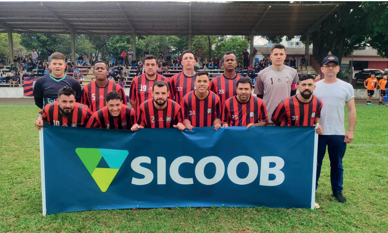
Milan conquistou a taça na categoria livre

O Laranja Mecânica Lendários, na Categoria Veterano, e o Milan, na Categoria Livre, sagraram-se campeões do 1º Campeonato Municipal de Futebol 7 de Encantado. Na final da categoria veterano, o Laranja Mecânica superou o Auto Elétrica Boaro por 5 a 2, garantindo o título. Na categoria livre, após empate em 1 a 1 no tempo regular, o Milan venceu o Clube Atlético Navegantes (CAN) nos pênaltis por 3 a 2. Os campeões e vice-campeões receberam troféus, medalhas e premiações em dinheiro, oferecidas pelo Sicoob, patrocinador do evento. Os destaques individuais também foram reconhecidos. Ramon Giacomolli foi o artilheiro e destaque da final na categoria