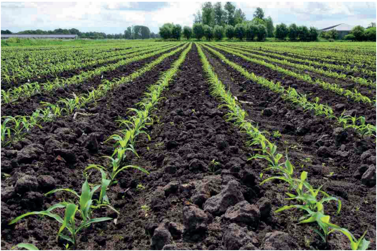
Lavouras voltam a produzir

A maior parte das lavouras de trigo encontra-se em fase reprodutiva (38% em floração e 19% em enchimento de grãos), e 43% das lavouras ainda estão em desenvolvimento vegetativo. A área cultivada, conforme dados da Emater/RS-Ascar, é de 1.312.488 hectares, e a produtividade prevista está em 3.100 kg/ha. A ocorrência de chuvas de intensidade variável, mas abrangentes, no começo de setembro, beneficiou as lavouras nas diferen-