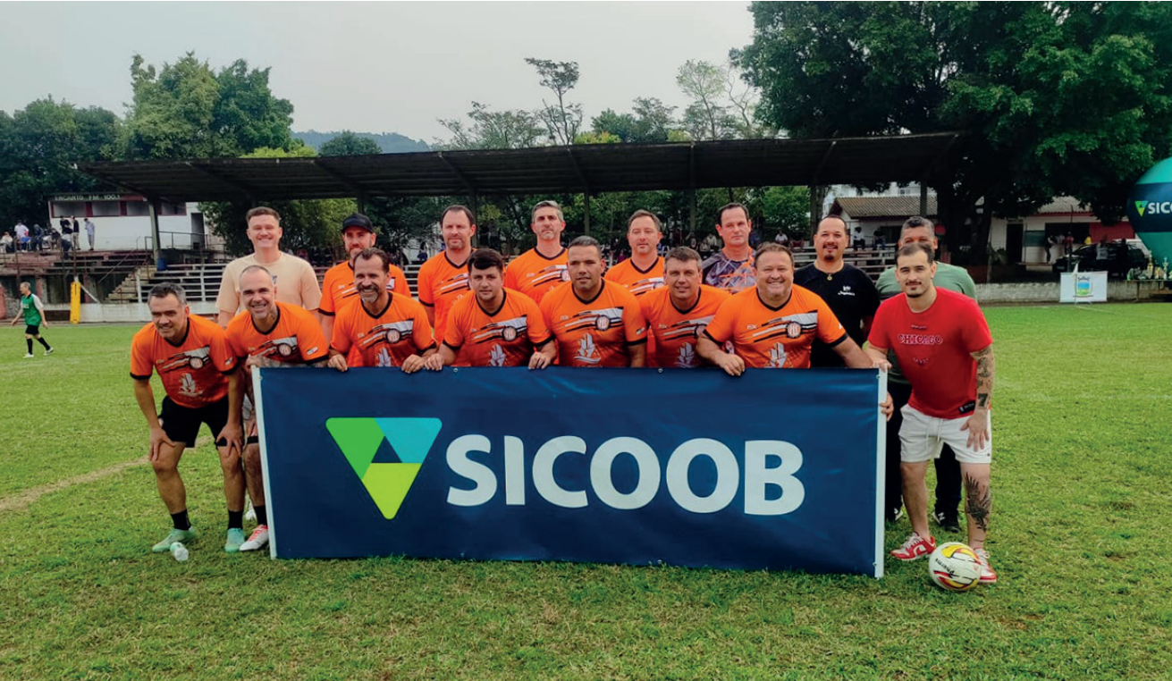
Laranja Mecânica foi o campeão na categoria veterano