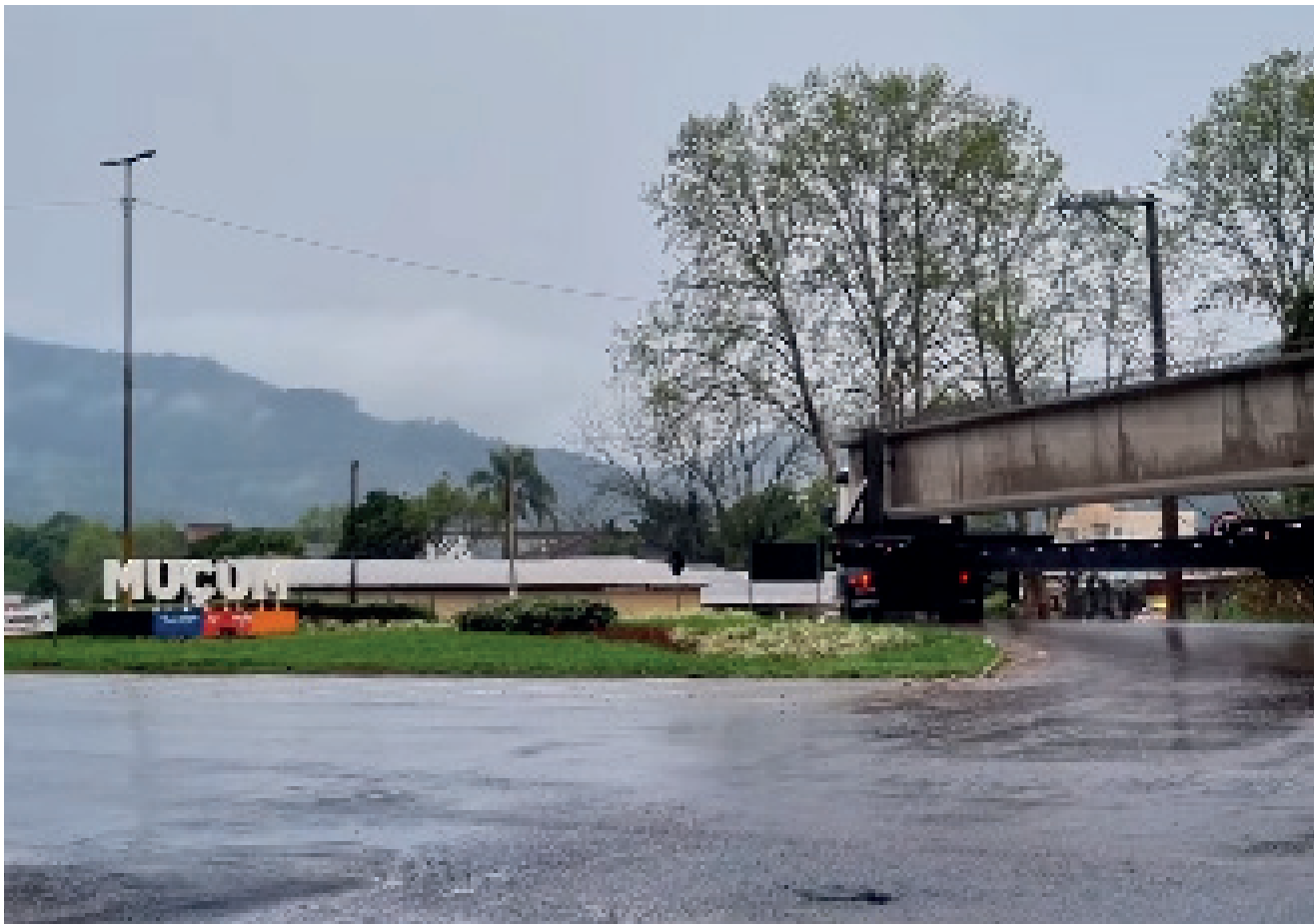
Primeira viga chegou na tarde de quinta-feira (12)

A chegada da primeira viga, dentro do prazo determinado da obra renova a esperança da população que anseia pela conclusão desta travessia, que conforme o cronograma da obra deve ocorrer em dezembro de 2024.