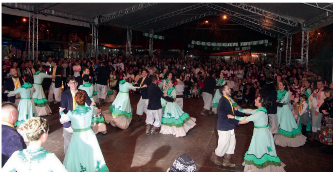
Em Encantado a Semana Farroupilha retorna a Praça da Bandeira