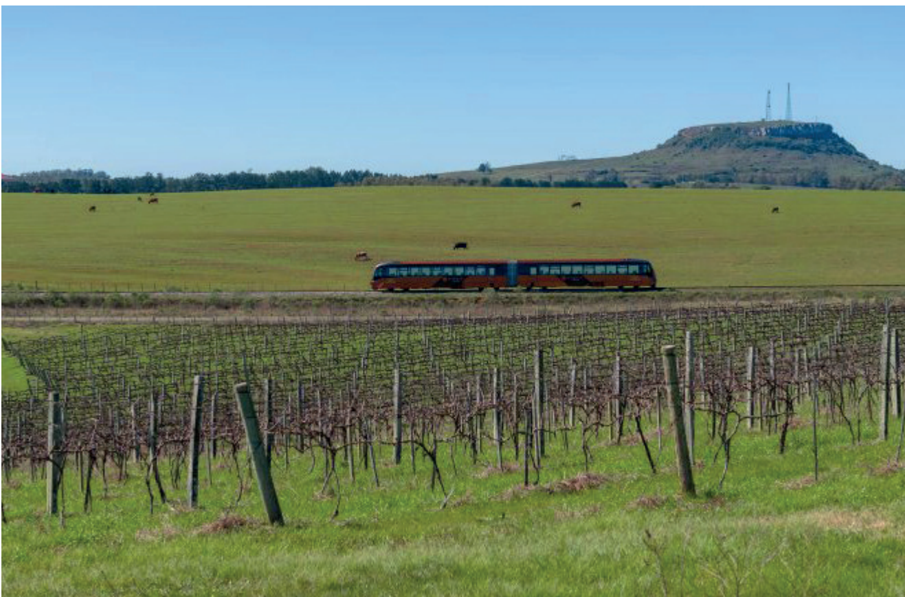
Trem do Pampa "cortará" os campos da Fronteira Gaúcha