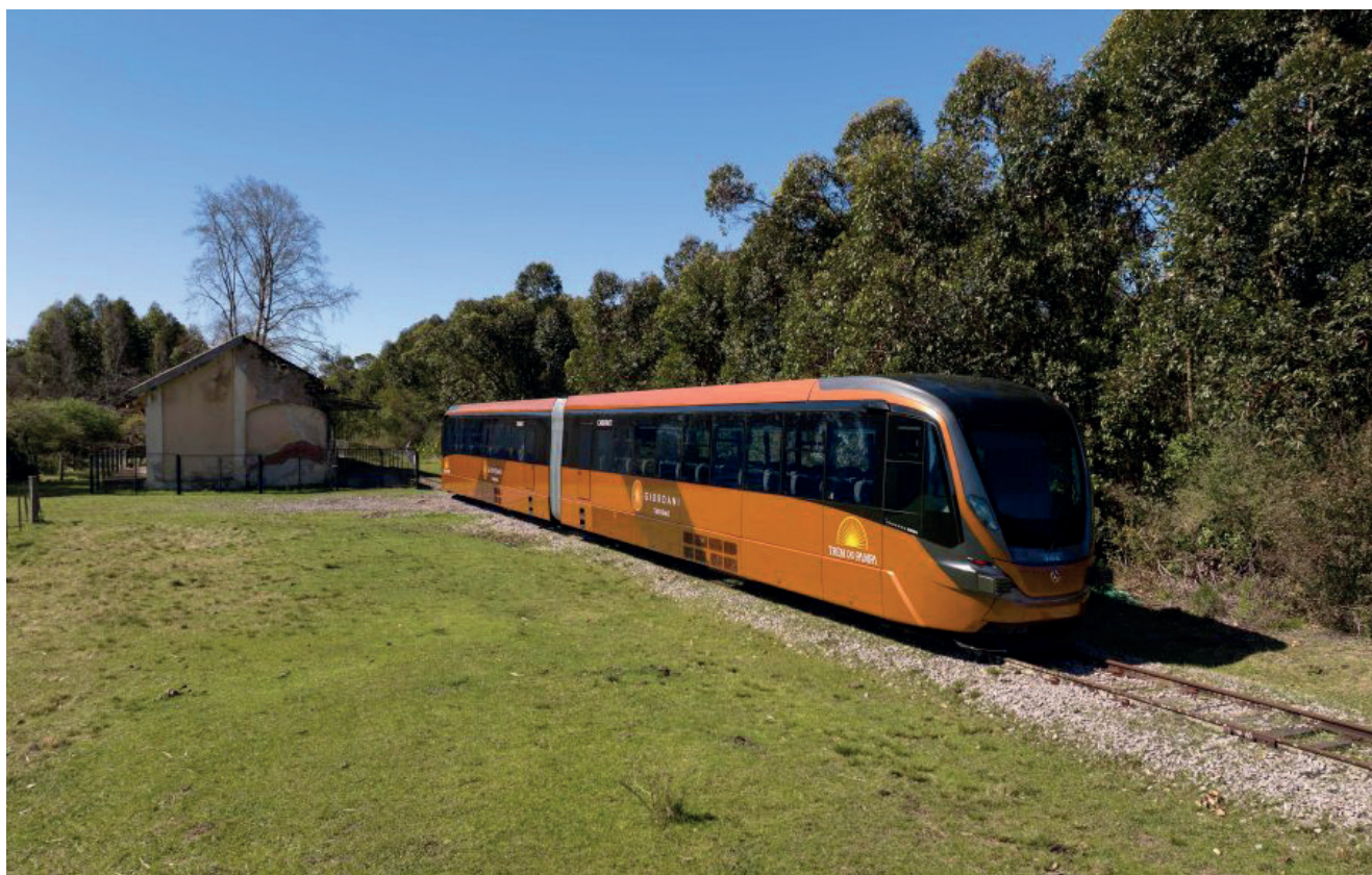
Trem do Pampa é uma nova atração turística que deve atrair turistas de fora do Estado

A nova atração, que promete incrementar ainda mais o turismo na “Fronteira da Paz”, tem envolvimento de três empresas da Serra