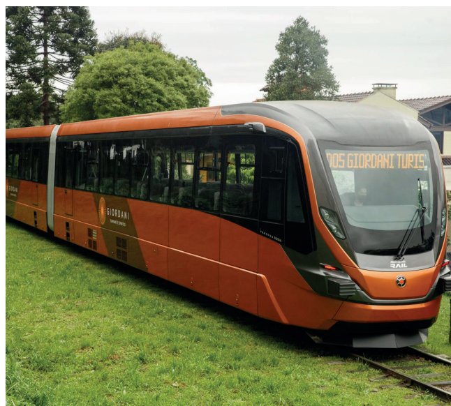
Passeio terá duração de três horas com paradas em vinícolas

Com saídas previstas aos sábados à tarde, a operadora já abriu horários extras para os domingos de julho devido à grande procura de bilhetes e período de férias escolares.