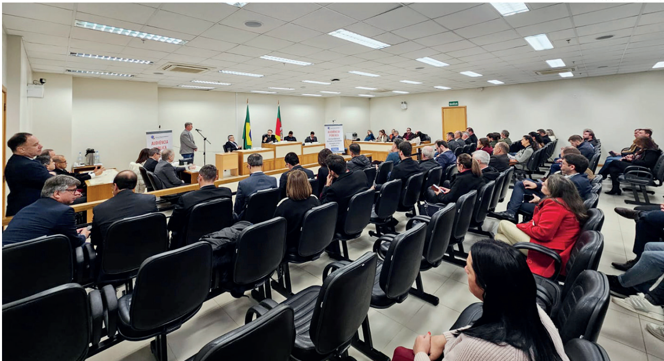
Audiência Pública que ocorreu no Fórum de Lajeado teve a presença de todo o Pleno do TRE do RS

SEÇÃO 66 e 83 – do Salão Comunitário do Lago