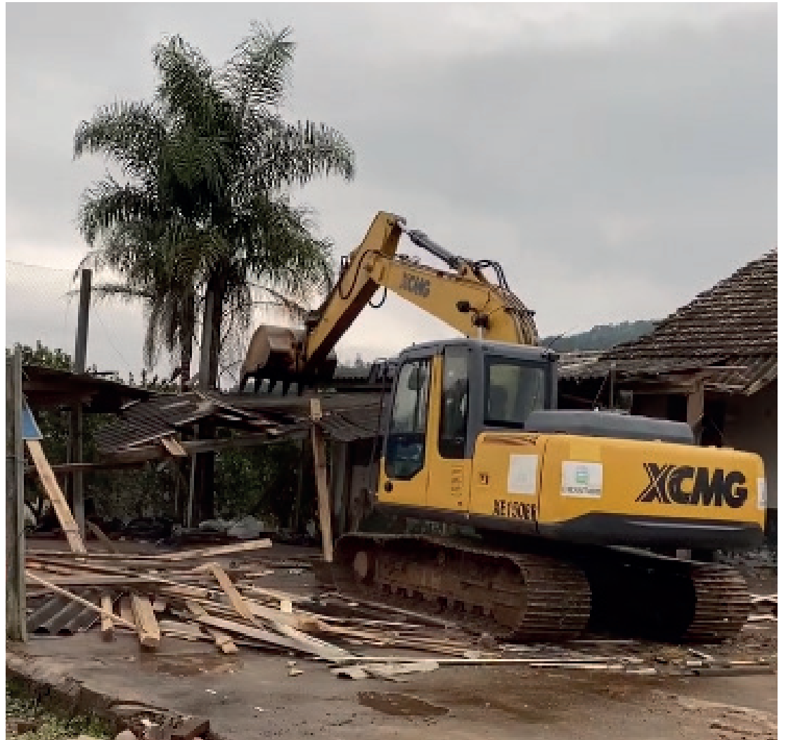
Casas serão construídas na área de terra da antiga Escola Batista Castoldi

Há pedido em análise na Defesa Civil Federal para a construção de mais 357 unidades habitacionais para os moradores afetados. A área dessas construções ainda não está definida.