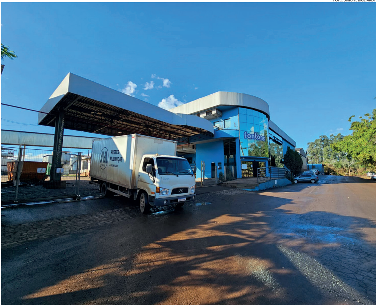
Sede da Fontana S/A fica no bairro Santa Clara em Encantado e passou por quatro cheias desde setembro de 2023, que trouxeram prejuízos enormes além da dificuldade em retomar a produção em sua totalidade

“Em Teutônia, no bairro Alesgut existe um prédio adequado para colocarmos a linha de produção dos sabonetes em barra e líquido estamos em fase de negociações, e assim que tivermos o contrato de locação assinado vamos fazer o comunicado oficial”. A Fontana definiu que irá executar duas fases, a primeira que é prioridade, é transferir a parte dos sabonetes para um local fora de área de risco. “Antes das cheias, fizemos um grande investimento de R$ 18 a R$ 20 milhões na compra de máquinas importadas que iriam dobrar a capacidade produtiva. Desde setembro de 2023, não conseguimos instalar nenhuma, e a decisão então é não instalar essas máquinas aqui em Encantado na sede atual da empresa, por isso vamos para um local seguro para que possamos começar a produzir novamente”.