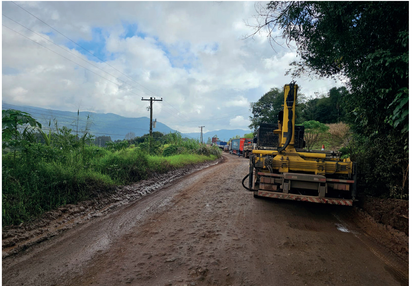
Trecho de estrada de chão de 6km da ERS 129 entre Roca Sales e Colinas causa lentidão para motoristas

O trajeto que antes era utilizado de forma