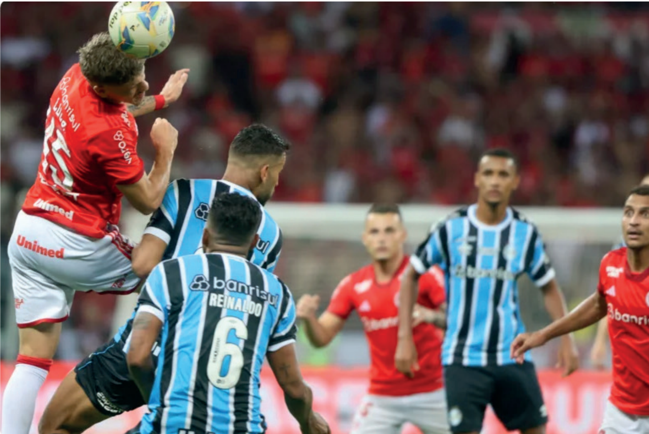
Internacional e Grêmio chegam pressionados para o Grenal deste fina de semana. Jogo será às 17h30min do sábado no Couto Pereira em Curitiba

O Grenal de número 442 será disputado no sábado (22), às 17h30min, no Estádio Couto Pereira, em Curitiba. As equipes chegam pressionadas para o clássico, o Internacional em situação um pouco melhor, pois venceu a última partida no Brasileiro contra o Corinthians por 1 a 0 e está na nona colocação com 14 pontos. Já o Grêmio amargou a quinta derrota seguida no campeonato e está na 18ª colocação com apenas 6 pontos. Nem quando foi rebaixado, em 2021, houve cinco derrotas consecutivas. É preciso voltar mais no tempo para encontrar um cenário como o de agora. Data de 2004, coincidentemente outro ano em que o destino foi a Série B do Campeonato Brasileiro.