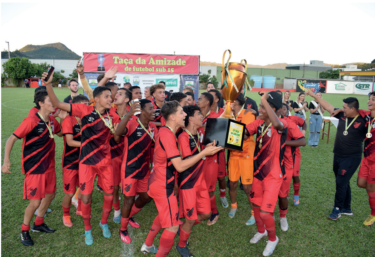
Atlético Paranaense é o atual campeão da Taça da Amizade

16h: Internacional x Athletico Paranaense