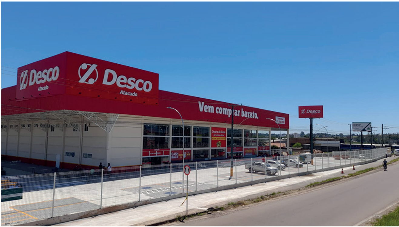
As duas novas lojas Desco Atacado no litoral gaúcho seguirão o padrão de layout e comunicação da nova Loja Desco de Sapiranga que é a mais recente inauguração do Grupo Imec

O Grupo Imec adquiriu duas lojas, pertencentes ao Grupo Carrefour, que operavam sob a bandeira Nacional, nas cidades de Xangri-lá e Imbé, no litoral norte gaúcho. O acerto definitivo depende de aprovação do Conselho Administrativo de Defesa Econômica (Cade). As aquisições fazem parte do planejamento estratégico da empresa, para os próximos cinco anos, divulgadas em março. Estas unidades serão as primeiras lojas do Grupo Imec no litoral gaúcho, e serão operadas com a bandeira Desco Atacado. A loja de Imbé está localizada na Av. Rio Grande, nº 10, nas proximidades da ponte da divisa com Tramandaí. Já a de Xangri-lá fica na Av. Paraguassu, 5509. As duas lojas terão um quadro de 240 colaboradores e a seleção será aberta nos próximos meses. As aberturas estão previstas para este ano. Segundo o Diretor-Presidente do Grupo Imec, Eneo Karkuchinski, a empresa está realizando o desejo de expandir no litoral gaúcho, para oferecer a proposta de valor do Desco, que é de servir as pessoas com qualidade, praticidade, simplicidade e economia. “Estamos chegando em duas cidades que estão em constante crescimento e, também, que marcam a entrada do Desco Atacado no litoral. É mais um grande passo para o Grupo Imec e estamos ansiosos para oferecer nossa proposta de valor para a população de Imbé, Xangri-lá e cidades vizinhas, bem como, quem passa a temporada de verão no litoral”, ressalta ele.