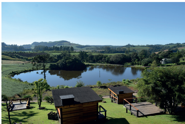
Vista do Chalé Potro Negro com a lagoa e a beleza exuberante da natureza e montanhas