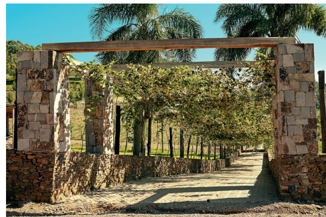
Entrada para os Chalés Valle di Pietre passando por um pórtico com rochas majestosas e parreiras