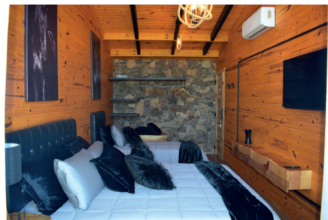
No Chalé Potro Negro há dois quartos que acomodam até seis pessoas