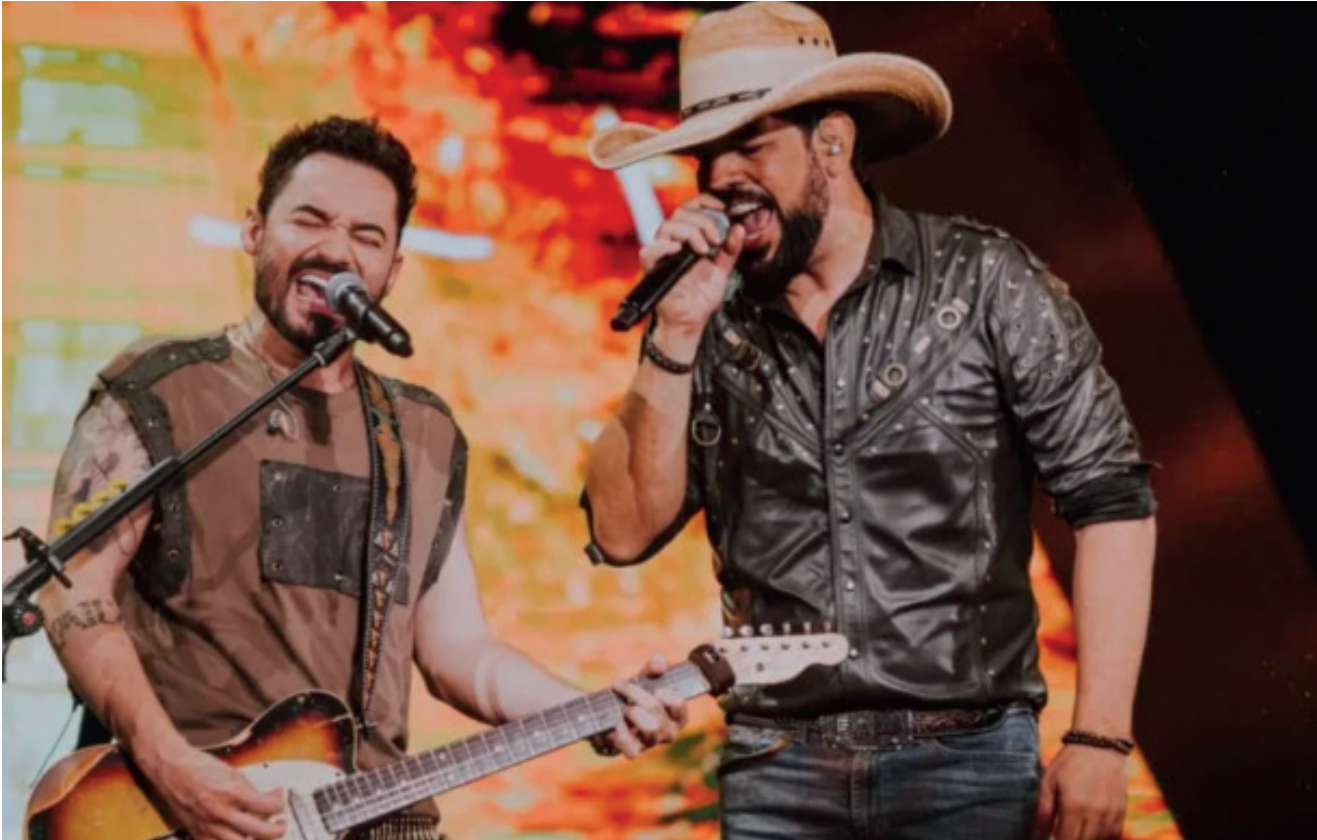
Show com Fernando & Sorocaba será no domingo, Gian & Giovani fazem show no sábado, ambos gratuitos. Na FestLeite tem o Salão da Gastronomia com comida liberada, feira comercial e industrial e muito agronegócio

De 25 a 28 de abril, Anta Gorda te espera para festejar a vida na 8ª FestLeite. A feira acontece no Parque Municipal de Eventos Aldi João Bisleri. O evento conta com o simpósio do leite, seminário da noz-pecã, salão da gastronomia, exposição e concurso de gado leiteiro, feira comercial e industrial, seminário regional da educação e shows. A abertura oficial aconteceu na noite de quinta-feira (25), antes, diversos outros eventos da feira ocorreram como, a abertura da colheita da noz pecã, exposição do gado leiteiro, encontro dos prefeitos da AMAT, primeiras damas e soberanas. A noite ainda teve a abertura do salão da gastronomia e show com a Banda Choppão. Nesta sexta-feira (26) às 8h30min acontece o VII simpósio da cadeia produtiva do leite, às 9h abertura dos estandes, às 14h30min desfile do gado jovem, 18h apresentação das Invernadas do CTG Lança Crioula, 18h30min Gala expressão de ballet e danças de Anta Gorda, às 19h30min abertura