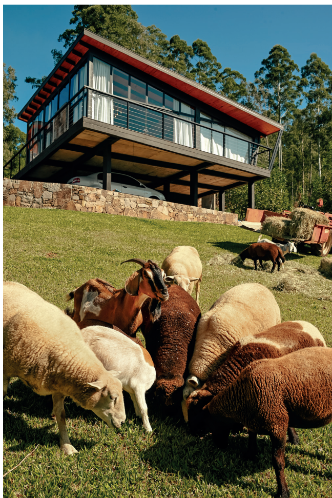
Interação com as ovelhas

na ERS 129 km 110, na divisa dos municípios de Vespasiano Corrêa e Dois Lajeados. Reservas e informações pelo whatsapp (54) 99279.3823, Instagram: @chalevalledipietre, Facebook: /chalevalledipietre.