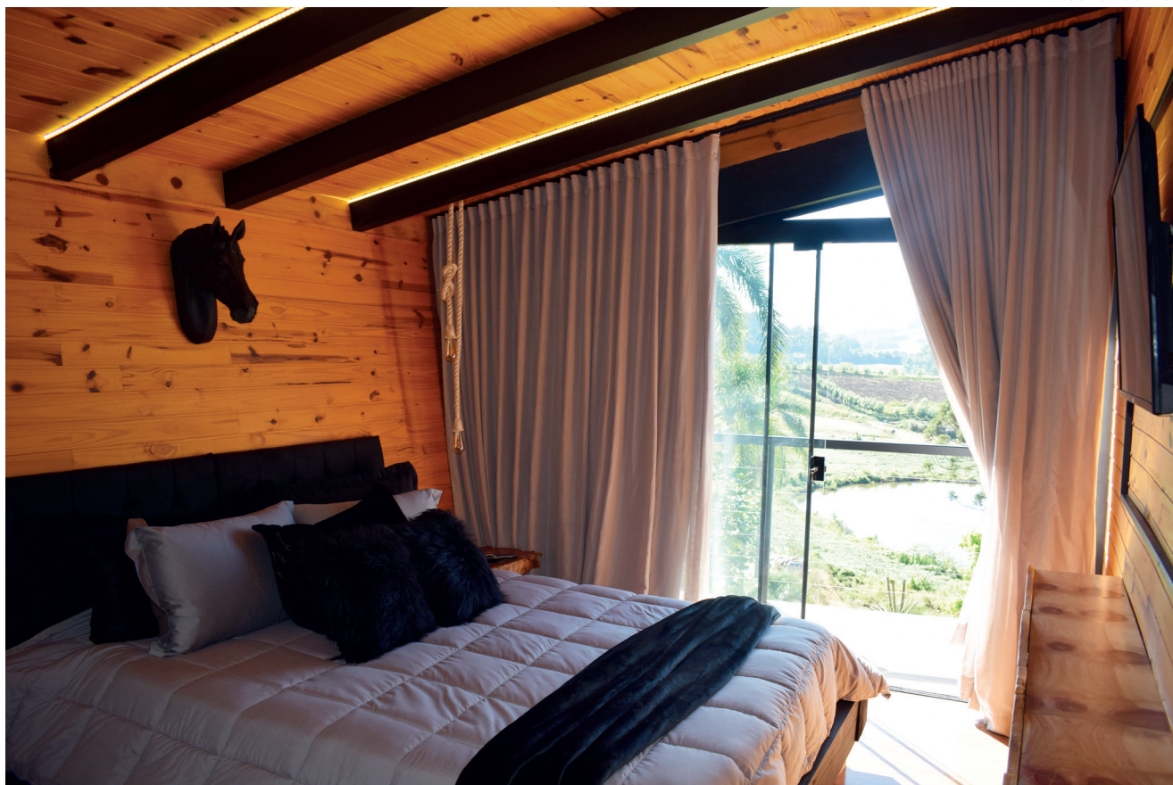
Quarto principal do Chalé Potro Negro tem uma vista deslumbrante da varanda, além de itens exclusivos de decoração

São dois chalés de dois quartos, dois de três quartos, dois de um quarto, dois apartamentos de dois quartos e oito suítes no total. Tudo isso para atender com excelência todas as necessidades dos hóspedes. Lareira, varanda, cozinha, sala exclusiva, contato com as ovelhas, caminhada pelas videiras são alguns dos diferenciais desta hospedagem que vale cada momento. O Chalé Potro Negro tem a diária de R$