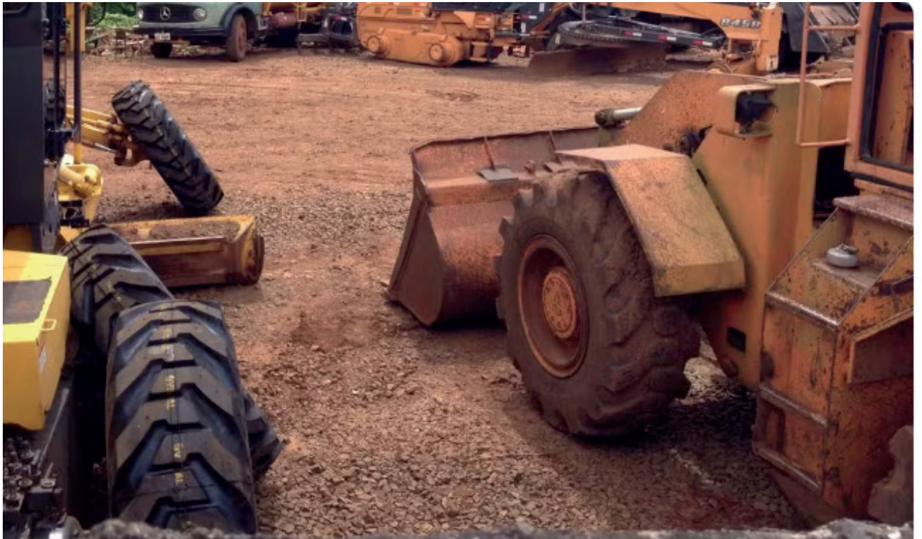
Ministério Público denuncia esquema de propina em licitações para aquisição de máquinas agrícolas, peças e manutenções de maquinário pesado em prefeituras entre os anos de 2010 e 2015

Até o momento, as investigações apontaram o envolvimento de 35 ex-prefeitos, três ex-vice-prefeitos e quatro ex-secretários. Os donos, funcionários e sócios da empresa também foram acusados. As acusações incluem organização criminosa, corrupção passiva e ativa e fraude em licitação, porém, os nomes dos investigados e da empresa não foram revelados.