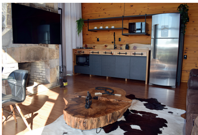
Chalés oferecem aos hóspedes cozinha e sala exclusivas com lareira