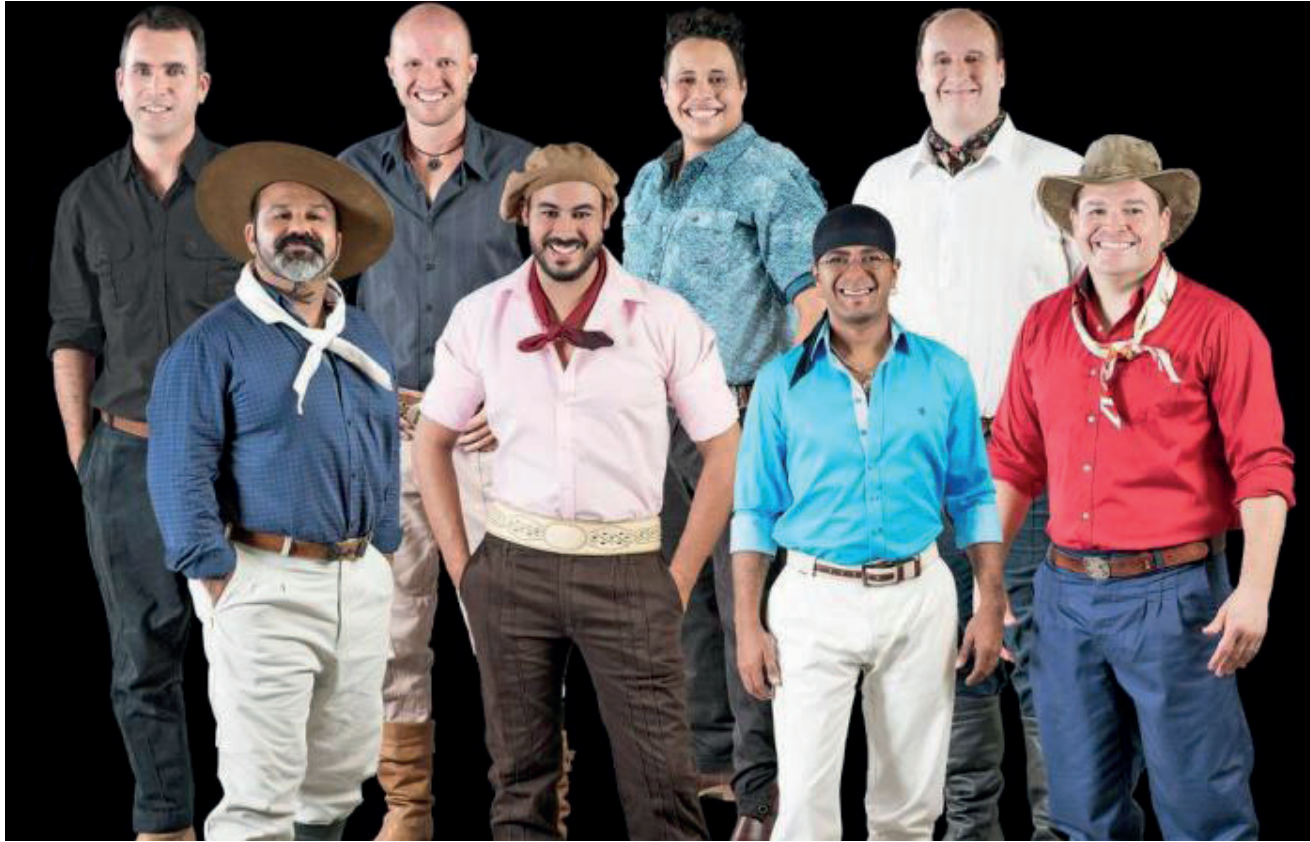
Coqueiro Baixo comemora 28 anos com diversos shows gratuitos entre eles: Tchê Barbaridade

O município de Coqueiro Baixo comemora 28 anos no dia 16 de abril, mas a festa será no próximo sábado, dia 20. O evento festivo será dividido em duas partes, de manhã às 10h será realizado a missa na Igreja São José, após, ao meio dia, terá o almoço no Salão da Comunidade. Para participar do almoço é preciso adquirir o ingresso pelo valor de R$ 30 para adultos e R$ 15 para crianças de 5 a 11 anos, crianças até 5 anos não pagam. Esses valores são para quem comprar de forma antecipada até o dia 17 de abril, o ponto de venda é na Prefeitura de Coqueiro Baixo. Caso restarem ingres-