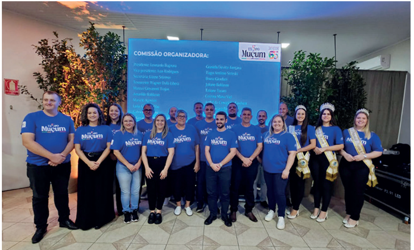
Comissão organizadora da ExpoMuçum 2024

Na noite de quinta-feira (11), a Administração Municipal de Muçum e a Câmara de Dirigentes Lojistas (CDL) de Muçum anunciaram o lançamento da 5ª ExpoMuçum - 2024 - Feira multisetorial de comércio, indústria, serviços, gastronomia, agronegócio, cultura e turismo de Muçum, que será realizada nos dias 30 e 31 de maio e 01 e 02 de junho, no Salão Paroquial e na Praça Cristóvão Colombo, no Centro da cidade. A feira busca impulsionar o comércio e as atividades econômicas, especialmente após o município ter sido afetado pela enchente de setembro de 2023. Este ano, a feira contará com uma série de atrações culturais e grandes shows, destacando-se apresentações do renomado grupo de pagode Revelação, Serginho Moah e Banda, Musical San Francisco, Anjos do Hanngar, Guilherme Mecca, Rainha Musical, e Adson e Alana. Com a gama de atrações, todas com entrada franca, a Comissão Organizadora espera receber cerca de 35 mil pessoas. Além da vasta programação cultural, a ExpoMuçum contará com uma feira comercial com 33 estandes internos, situados no Salão Paroquial, e 15 agroindústrias na parte externa, juntamente com uma variada Praça de Alimentação. Com um foco especial no comércio local, os estandes estão disponíveis