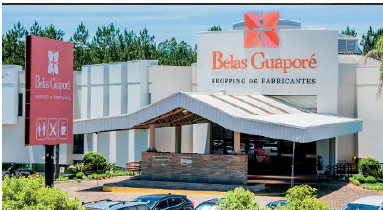
Belas Guaporé está localizado na ERS 129 próximo ao trevo de acesso principal a Guaporé

Para mais informações entre em contato pelo (54) 3443-5225 ou pelo whatsapp (54) 98434-6614.