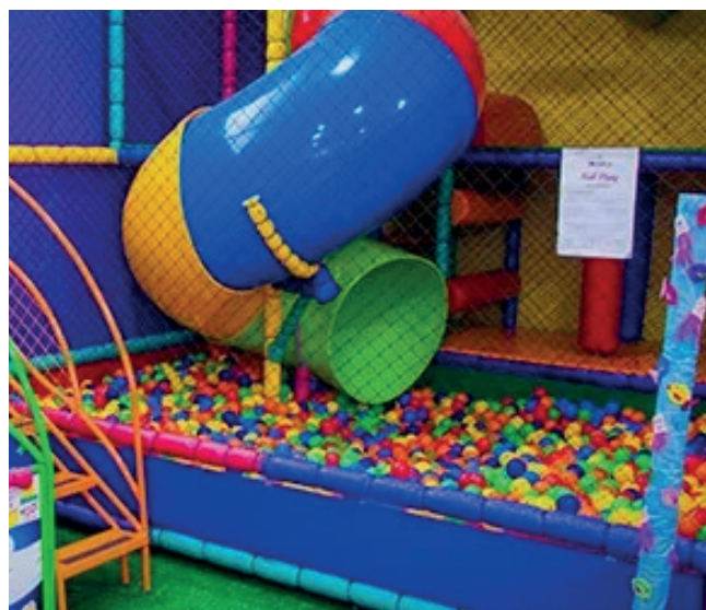
Brinquedoteca para as crianças