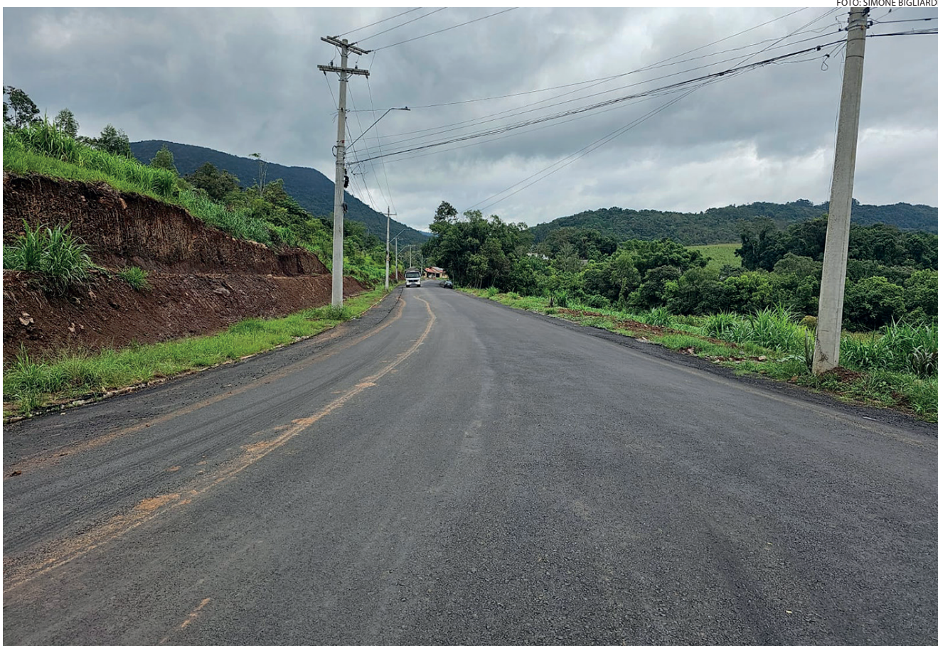
Avenida Integração, principal rua da comunidade de Palmas agora é Avenida Joel Bottoni