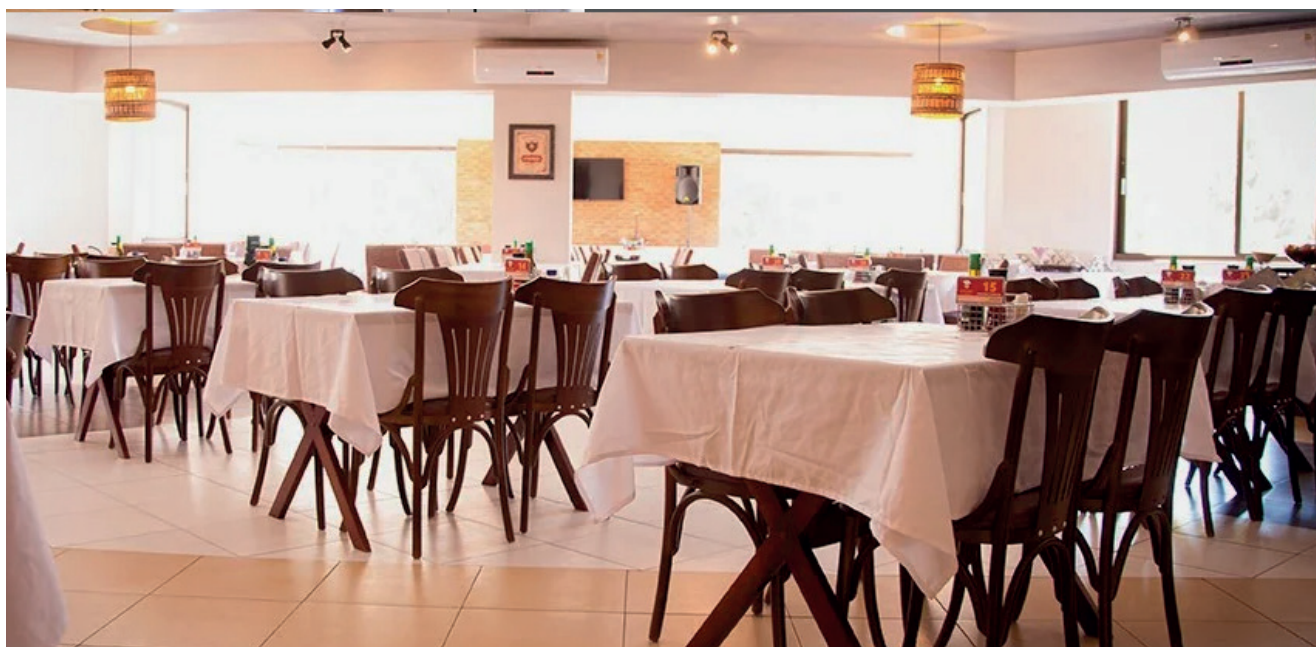
Área do Restaurante e Pizzaria Di Nonno