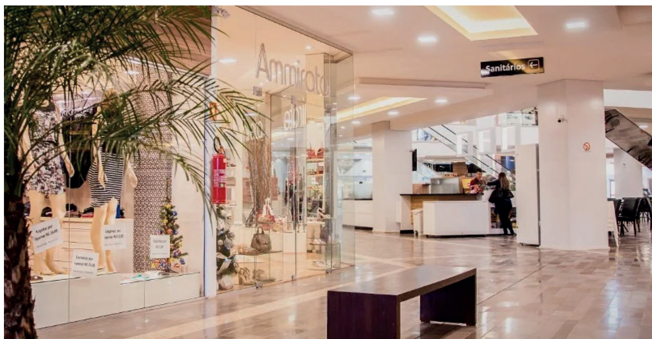
Área de lojas que vendem joias, lingerie e vestuário direto de fábrica