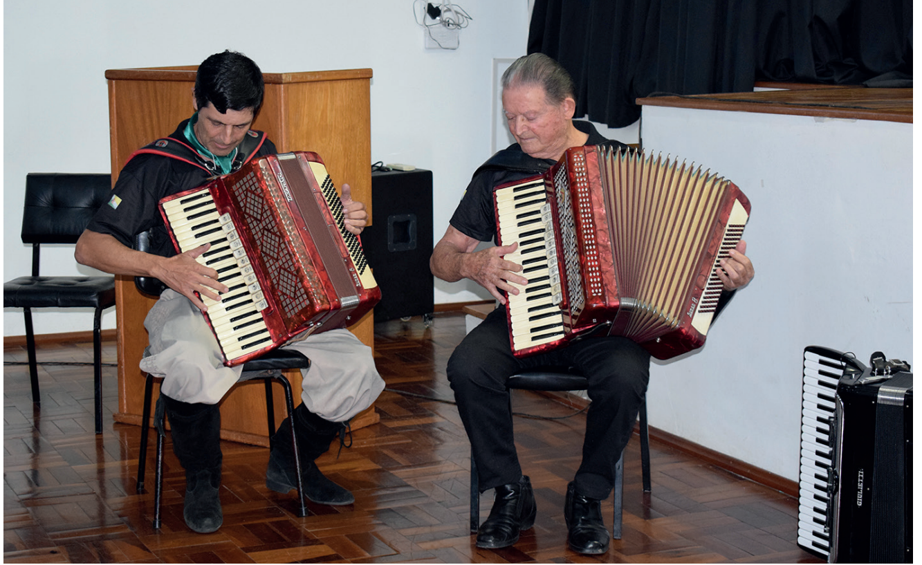
Evento começa na quarta-feira (10) com o Festival dos Gaiteiros

O Festival dos Festivais acontece de 10 a 14 de abril, na Praça da Matriz, em comemoração ao aniversário de 59 anos de Nova Bréscia. A programação terá no dia 10 o Festival dos Gaiteiros e à noite jantar baile com Os Serranos. No dia 11, aniversário de Nova Bréscia, terá missa de ação de graças pela manhã, à tarde brinquedos infláveis e à noite show com Baitaca e Grupo Levada. O Festival dos Churrasqueiros e da Mentira tem a abertura no dia 12, com apresentação da Orquestra Municipal e Corais e após Banda Werner e Cia com convidados. No dia 13 inicia as apresentações das mentiras no Clube Tiradentes, durante o dia shows com Alma Nova, Sol Vanera, Ceba Gaúcho, Família Azzollini e Banda Corpo e Alma. No dia 14 será conhecida a melhor Mentira do Festival, o dia também terá shows com Garotos do Surungo, Os Atuais, Alan e Aladim & Badin o Colono. Na sexta à noite, sábado de meio-dia e à noite e domingo de meio-dia terá o prato de churrasco gratuito.