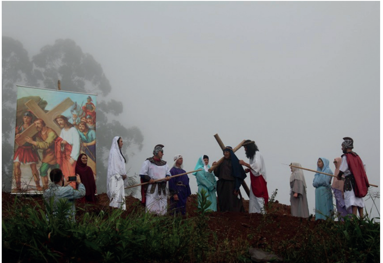
Pessoas de todas as comunidades de Encantado são os personagens da encenação viva dos quadros da Via Sacra que tem o início na Lagoa da Garibaldi e segue até o Cristo Protetor

A Via Sacra é um momento de oração e reflexão sobre o sofrimento de Jesus Cristo e o significado da fé cristã. É também uma oportunidade para os fiéis meditarem sobre seus próprios sofrimentos e encontrarem força e esperança na fé. As 14 estações serão encenadas (em forma de quadro vivo) por