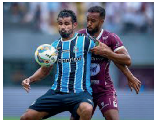
Grêmio garante vaga na final com um empate

Já o segundo confronto das semifinais entre Grêmio e Caxias será na terça (26), às 21h, na Arena. O primeiro jogo teve a vitória do Grêmio por 2 a 1 no Estádio Centenário em Caxias do Sul. No jogo da volta o Tricolor joga com a vantagem do empate. Em caso de vitória por um gol de diferença para o Caxias a decisão irá para os pênaltis. As duas equipes que chegarem a final irão se enfrentar no dia 31 de março, domingo de Páscoa e o segundo jogo da final será no domingo, 7 abril.