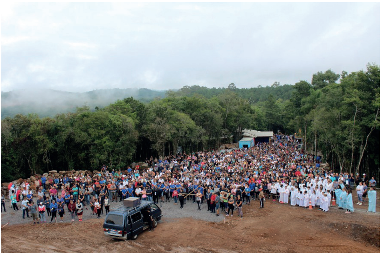
No ano passado centenas de pessoas acompanharão a procissão