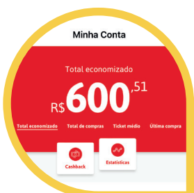
Cashback (MENU CONTA > CASHBACK)