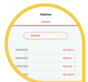
Seu Histórico de Compras