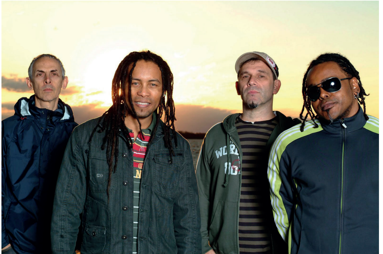
Show de encerramento será com Papas da Língua

A programação é organizada pela Administração Municipal de Encantado.