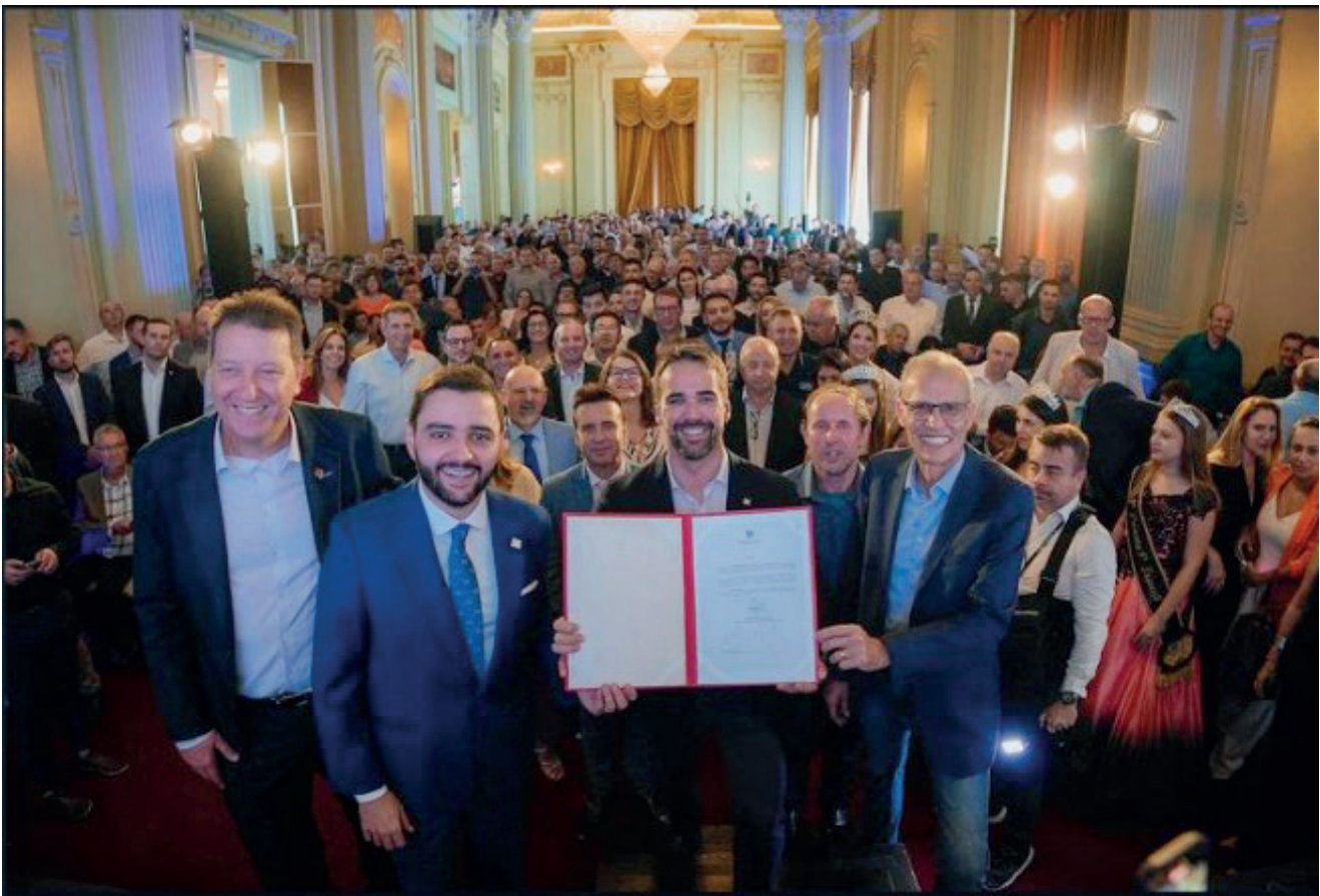
Municípios contemplados assinaram o convênio com o Estado na quarta-feira

Muçum foi contemplado com R$ 1 milhão do Governo do Estado, o município dará