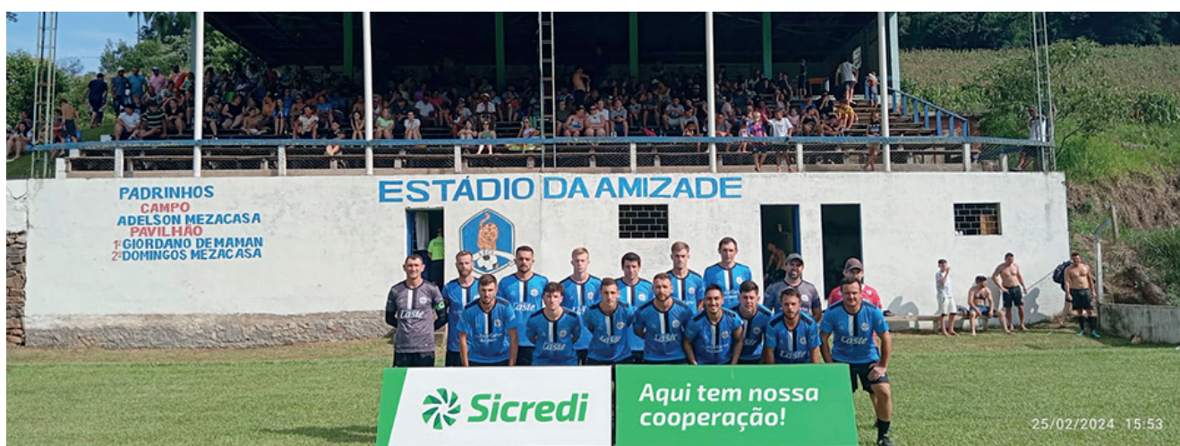
Cristal precisa vencer para seguir com chances de classificação

De manhã às 8h pelos aspirantes se enfrentam Imigrante e Botafogo, às 10h o confronto será pela categoria titulares. À tarde, Atlético Caçadoreense x Cristal jogam às 13h30min nos aspirantes e às 15h30min pelos titulares.