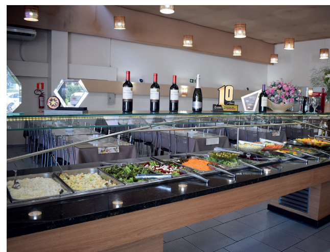
Buffet com muitas variedades de saladas