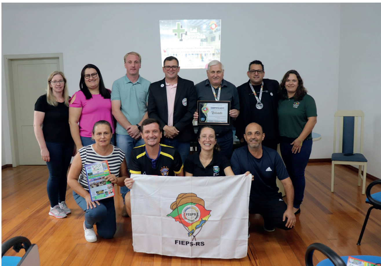
Relvado investe em qualidade de vida e saúde para alunos das escolas municipais