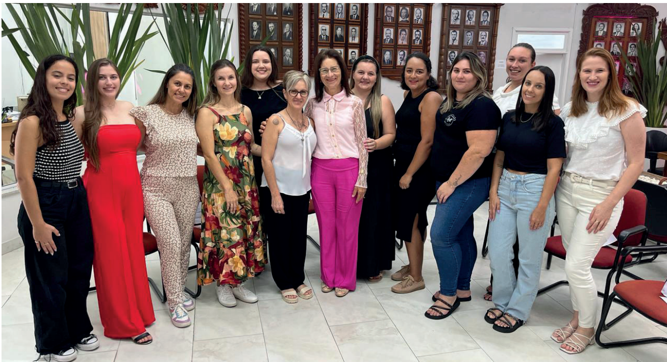
Homenagem as fotógrafas