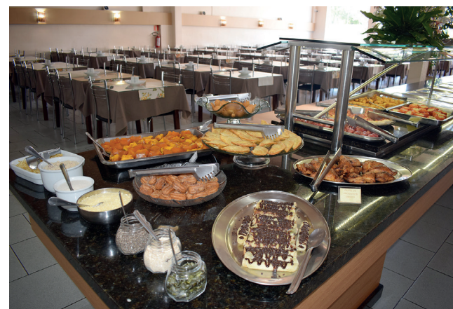
A famosa panqueca de chocolate e outras delícias