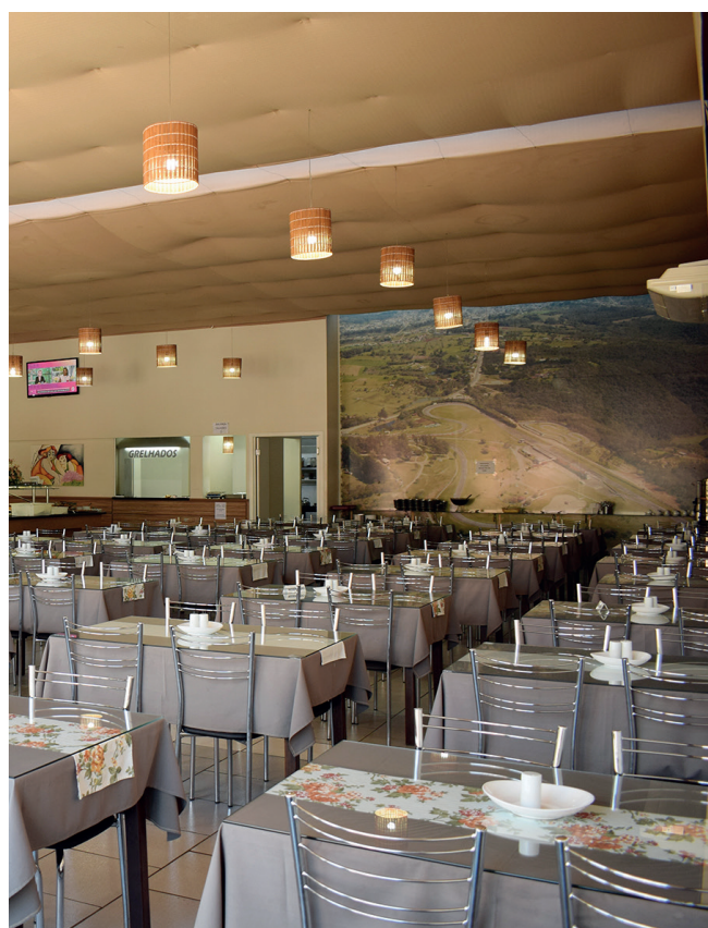
Lugar amplo e muito bonito

WhatsApp (54) 99971-3586. Facebook: Restaurante Central Guaporé.