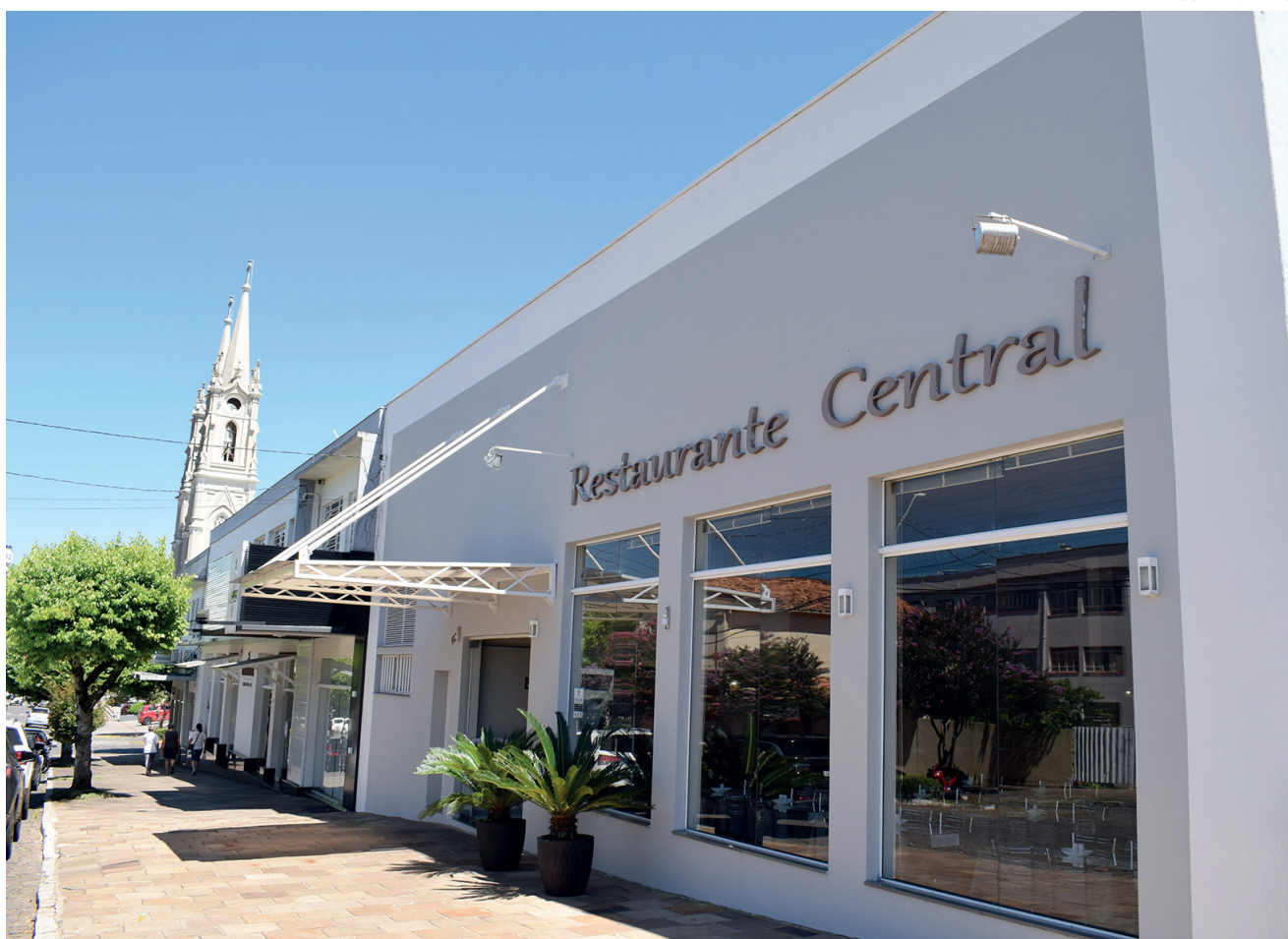
Restaurante Central de Guaporé fica bem no centro, muito próximo da Igreja Matriz

O Restaurante Central está localizado na