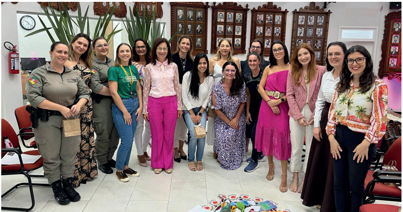
Homenagem as lideranças femininas do executivo, legislativo, judiciário, segurança pública e entidades