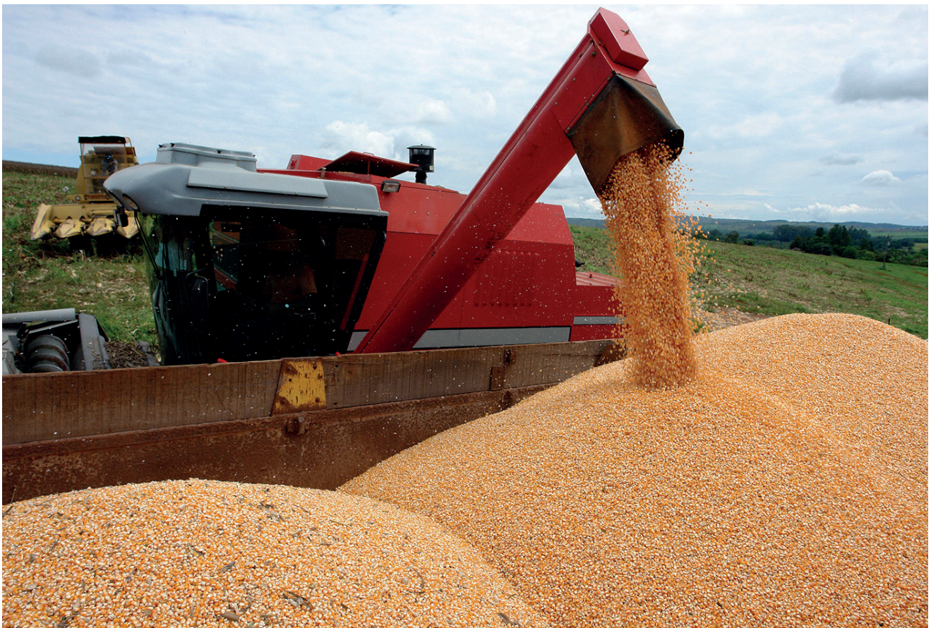
Alta de 45,7% comparando com 2023

2022/23. A área destinada ao plantio do cereal é de 1,40 milhão de hectares, uma queda de 6,5%.