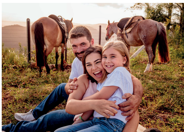
Momentos únicos perto de quem se ama