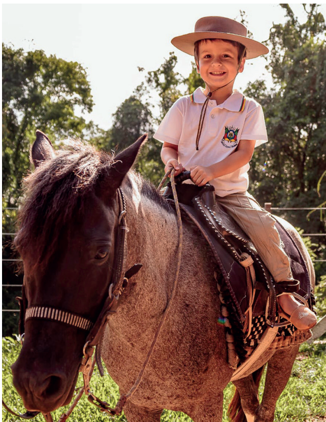
Crianças acima dos quatro anos podem cavalgar

através das redes sociais, Facebook ou Instagram: Equoterapia Abraço Forte, ou pelo whatsapp (51) 99846.5116. Os horários são de terça-feira a domingo das 7h30min até às 18h30min.