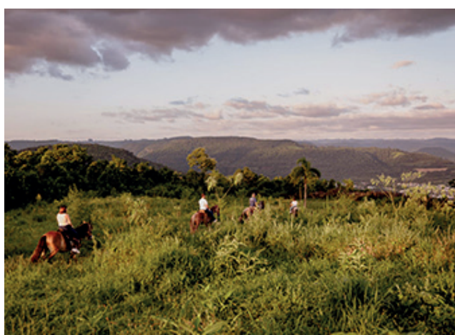
Na cavalgada é percorrido trilhas que levam a belas paisagens, passeio pode ser feito até quatro pessoas