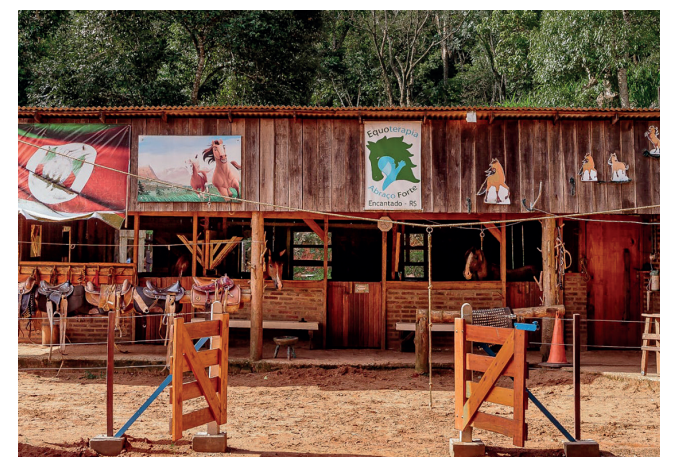
A partida é de frente ao estábulo