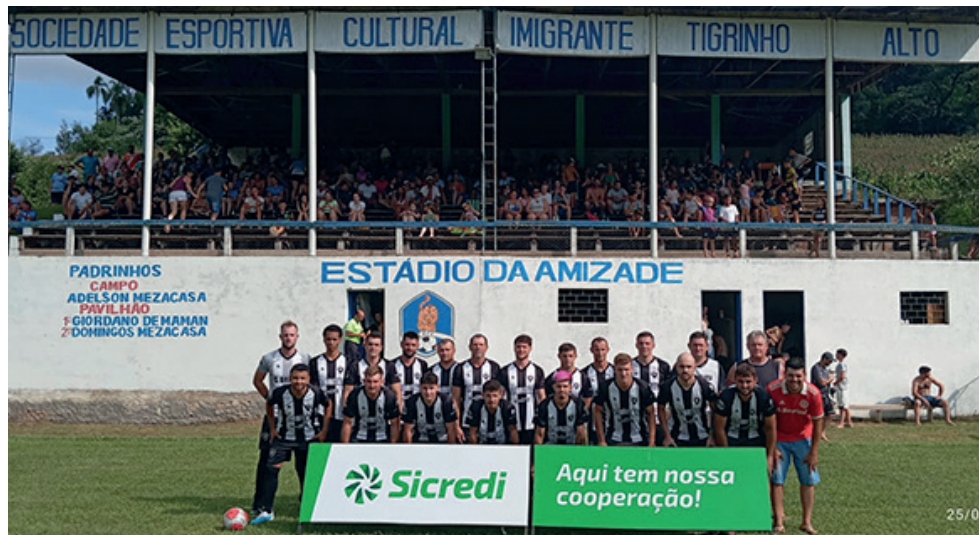
Botafogo de Jacarezinho estreou com vitória

No domingo (25) o Magnatas da Bola de Encantado conquistou o Tricampeonato do Curta Verão de Lajeado, na modalidade basquete 3 x 3. As partidas foram no Parque dos Dick e a equipe encantadense venceu todos os jogos. Foram cinco vitórias no total, na fase classificatória Magnatas da Bola 13 x 11 Saints Family, Magnatas 15 x 8 Underdogs e Magnatas 21 x 11 Real Madrid. Na semifinal vitória de 18 x 7 frente ao Underdogs e na final 12 x 5 para o Magnatas contra o Real Madrid.