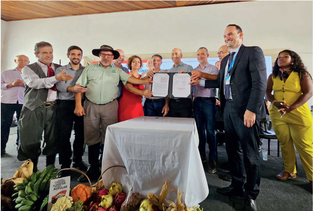
Termo de Cooperação foi assinado ontem em Muçum e beneficiará 600 famílias em todo o Estado

A enchente de setembro destruiu muitas casas nos municípios da região. Parte delas serão reconstruídas e entregues ainda esse ano. Na quinta-feira (29) foi assinado o Termo de Cooperação entre o Governo Federal, Caixa Econômica, Cohab, Coohaf, Contag, Cooper Hab e Fetag-RS que irá reconstruir 600 moradias rurais em diversos municípios do Rio Grande do Sul. A assinatura ocorreu no Clube José Garibaldi de Muçum, pois o município tem o maior número de residências contempladas. As casas serão construídas através do Programa Minha Casa, Minha Vida Rural - Calamidades. O valor por residência é de R$ 75 mil a fundo perdido. Dos municípios da região, Muçum foi contemplado com 36 casas, Roca Sales 11, Santa Tereza 10, Encantado 8, Doutor Ricardo 14, Colinas 14, Arroio do Meio 27, Cruzeiro do Sul 25 e Bom Retiro do Sul 4. O projeto para a construção das casas no interior foi encaminhado pelo Sindicato dos Trabalhadores Rurais (STR) dos municípios através da Cooperativa de Habitação da Agricultura Familiar (COOHAF) com auxílio da Emater e dos Municípios.