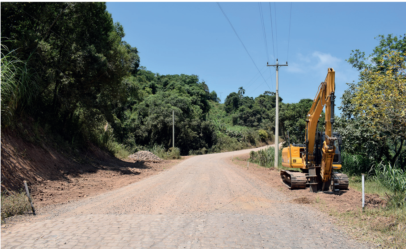
Máquinas já estão trabalhando no asfalto em direção a comunidade de Linha Estefânia em Nova Bréscia

E os projetos e obras em Nova Bréscia não param, pois a ideia da Administração Municipal é também levar o asfalto em direção a comunidade de Linha Pinheiros.