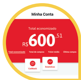
Cashback (MENU CONTA > CASHBACK)