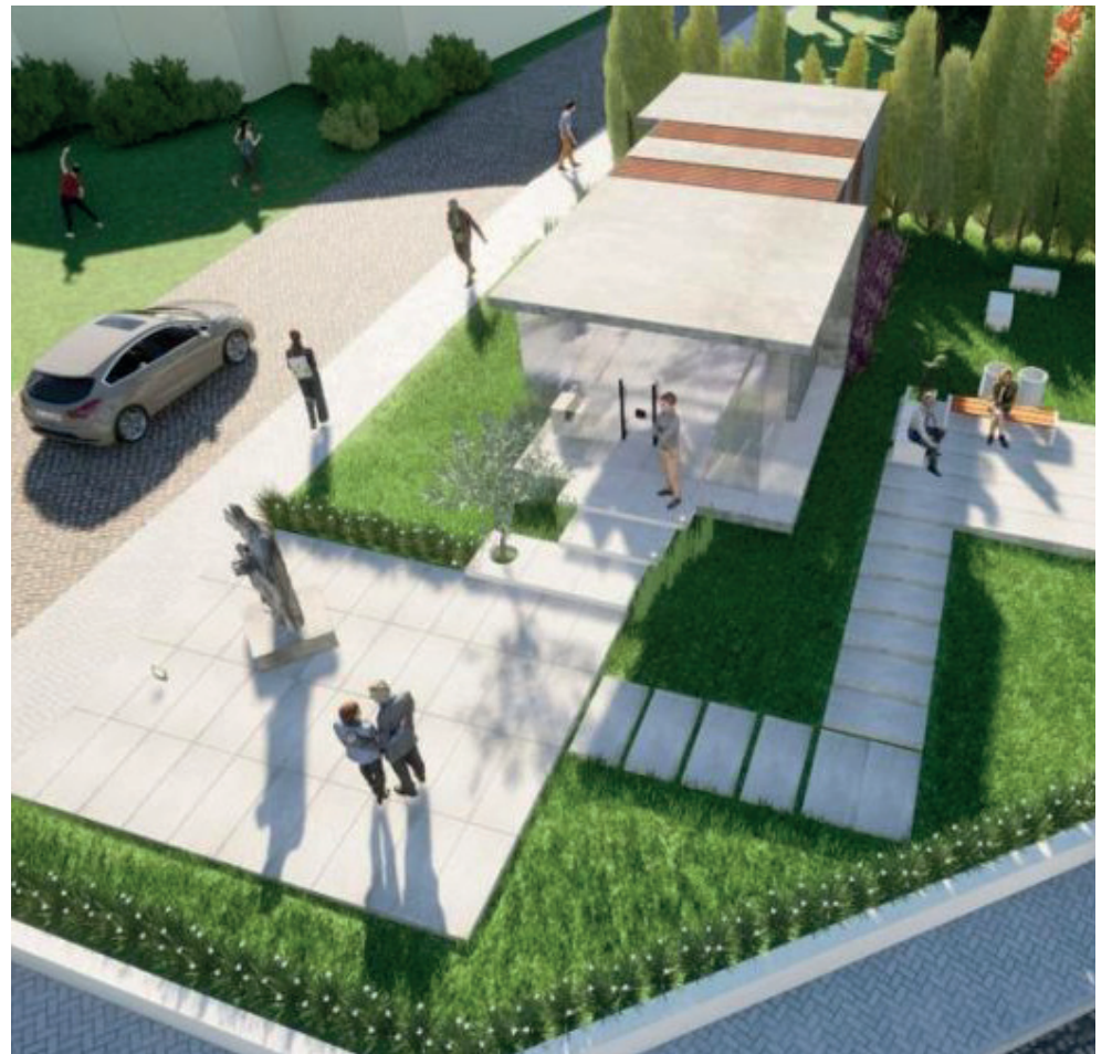
Além de uma bela homenagem ao filho de Relvado espaço irá impulsionar o turismo