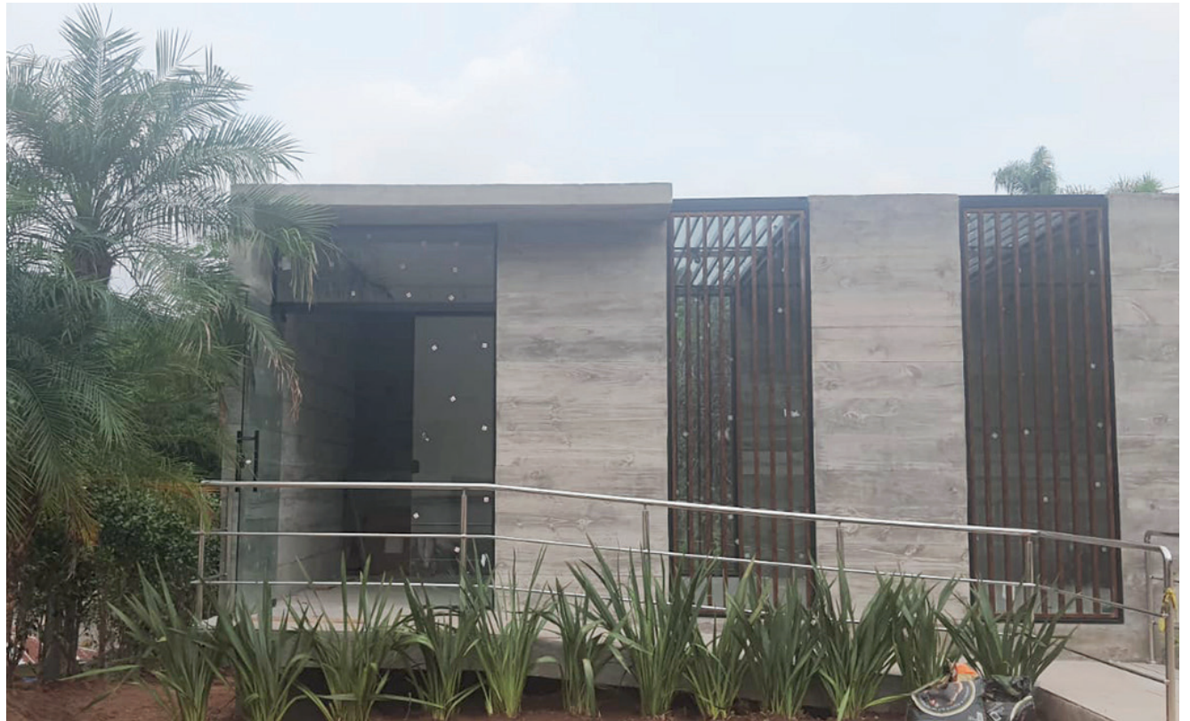
Memorial Dom Genitl Delazari está construído em uma área de 38,60 m 2