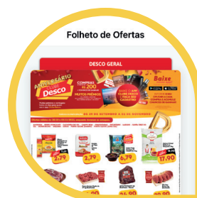
Todas Nossas Ofertas