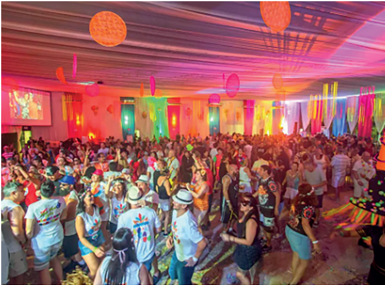
Festas nos Clubes e Ginásios da região prometem animar os foliões